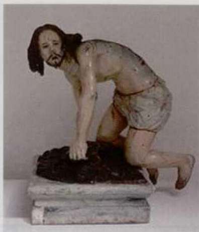
Fig. 3. ANÓNIMO: Cristo recogiendo sus vestiduras, Siglo XVIII. Madera policromada. La Paz (Bolivia), Museo Nacional de Arte.