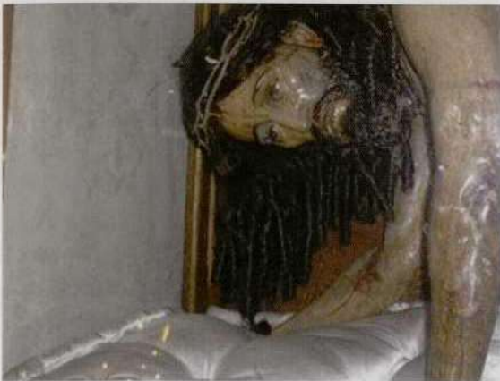
Fig. 5 ANÓNIMO: Cristo caído, Siglo XVIII. Madera policromada. Ciudad de Guatemala (Guatemala), Iglesia de Candelaria.

mentalmente en los antiguos virreinos del Perú y Nueva Granada, y en la Real Audiencia de Quito, en el arco que comprende los actuales países de Colombia, Ecuador, Perú y Bolivia. A la ciudad de Santa Fe de Bogotá, sede episcopal, y centro administrativo de primer orden, pertenece el pintor Gregorio Vázquez de Arce y Cevallos 7 , de familia sevillana emigrada a América, es considerado como el mejor pintor de la época colonial colombiana. Para la iglesia parroquial de la Calera en Cundinamarca pintó una pequeña serie compuesta de cuadro lienzos con escenas de la pasión de Cristo, en donde dedica un cuadro a Cristo recogiendo las vestiduras (Fig.1), del que conservamos dibujo preparatorio. En general, la composición