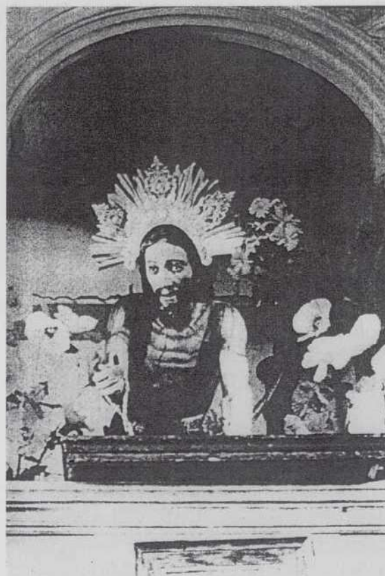
Fig. 7 ANÓNIMO: Cristo recogiendo sus vestiduras, Siglos XVII - XVIII. Madera Policromada. San Cristóbal de las Casa (México), Iglesia de Santiago Apóstol.

KNIPPING, John B, Iconography of the counter reformation in the netherlands: