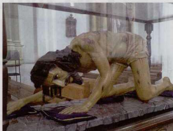
Fig.4 ANÓNIMO: Cristo caído, Siglo XVIII. Madera policromada. Antigua Guatemala (Guatemala), Iglesia de la Merced.

Del modelo de Cristos caídos con la espalda curva 6 , encontramos obras funda-