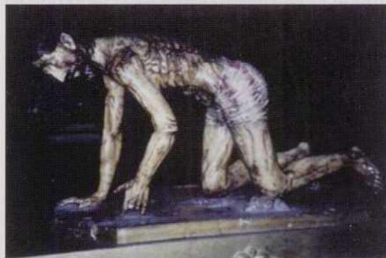
Fig. 6. ANÓNIMO: Cristo caído, Siglo XVIII. Madera policromada. Ciudad de Guatemala (Guatemala), Iglesia de Santo Domingo

recuerda al grabado de Galle (Fig. 2), el arqueamiento de la espalda los brazos rectos apoyados en el suelo, pero muy transformada. Las otras dos obras que pertenecen a este grupo son de carácter bien distinto. Tanto la pequeña imagen de Cristo recogiendo las vestiduras del Museo Nacional de Arte de Bolivia (Fig. 3), como la tabla dieciochesca, de propiedad privada, son un buen ejemplo de que el tema no quedo restringido a los altares de las iglesias sino que se introdujo al ámbito de las devociones privadas en obras de pequeño formato y materiales pobres, de ahí ese estilo popular, casi artesanal, que muestran. Ambas siguen el modelo de Cristo encorvado que popularizara la estampa de Galle, mucho más visible en el caso de la escultural, la cual repite puntual-