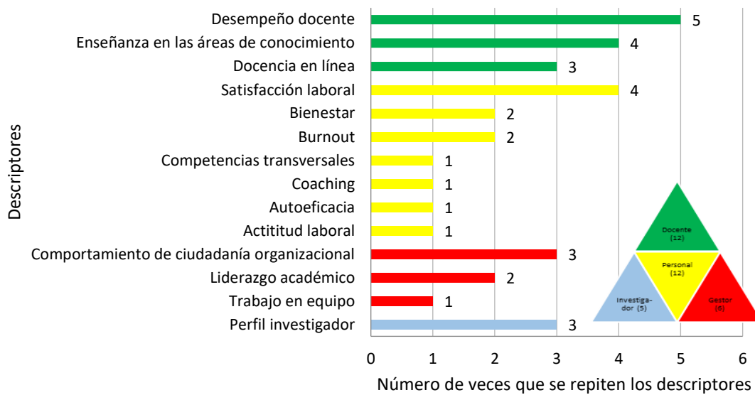
Figura 3. Descriptores asociados a la Inteligencia Emocional del profesorado universitario

Aunque es insuficiente el volumen de investigación para cada uno de los descriptores, la esencia de las conclusiones que muestran la totalidad de los trabajos seleccionados concluye sobre la existencia de una relación significativa entre la inteligencia emocional del profesorado universitario y las variables de estudio. Así lo avala el rigor metodológico de los trabajos, en su mayoría de carácter cuantitativo, y la amplitud de las muestras.