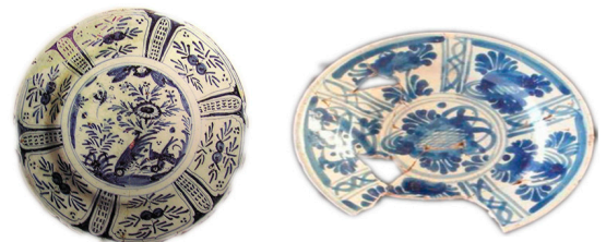
Figura 2. En los Casos 3 y 4, las imágenes situadas a la izquierda son producciones talaveranas, las imágenes de la derecha son poblanas.