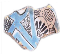
Figura 3. En los Casos 5 y 6, las imágenes situadas a la izquierda son producciones talaveranas, las imágenes de la derecha son poblanas.

Colección de la Casa del Mendrugo. Estamos ante un plato tipo San Luis azul sobre blanco , de la primera mitad del siglo XVII y elaborado en Puebla (YANES, 2013: 401). Estas piezas no hacen sino imitar a porcelanas chinas, concretamente la división de la composición debe haberse inspirado en las porcelanas Wanli , tipo kraak , que habrían llegado a España a comienzos del siglo XVII (GONZÁLEZ, 2003: 142). Además, este tipo de decoraciones están en estrecha relación con las lozas portuguesas de la serie aranhoes , una de las producciones lusas que alcanza mayor fama (CASIMIRO, 2010: 597).