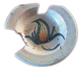
Figura 1. En los Casos 1 y 2, las imágenes situadas a la izquierda son producciones talaveranas, las imágenes de la derecha son poblanas.