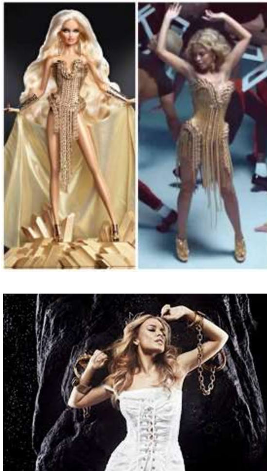
Figuras 6 ,7 y 8. Muñeca Barbie representando a Kylie Minogue; la actriz y cantante Kylie Minogue en uno de sus espectáculos; fotograma de un video clip de Kylie Minogue 4 .

encarna diversos mitos griego, siendo en el videoclip Get outta my way , en el que aparece una alusión a Andrómeda a través del elemento iconográfico de las cadenas. En este caso la cantante viste un corpiño dorado de la firma neoyorkina The Blonds tejido con cadenas de oro, conjuntado con pendientes de cadenas y unos zapatos Louboutin dorados, junto con unas garras de harpía en sus uñas. Todo dorado, a modo de diosa aparece con una estética que nos rememora un hibridismo entre dos mitos clásico, por una parte Afrodita diosa del amor y la belleza, y a Andrómeda por las reminiscencias en el elemento iconográfico de las cadenas. Elemento iconográfico que repite al aparecer encadenada a una roca en uno de sus videoclips (Fig. 8).