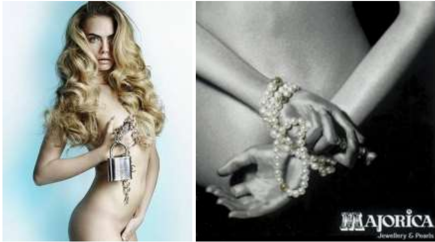
Figuras 11 y 12. La modelo Cara Delevingne, encadenada a Chanel ; Anuncio de joyas Majorica . 5

un candado y cadena de Chanel. Una forma erótica de anunciar el invierno próximo para una sesión de fotos de moda para la revista Allure Magazine, que está especializada en la belleza de moda. (ABC, 2014).