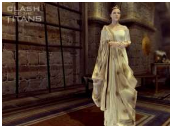
Figura 5. Andrómeda en el videojuego Clash of the Titans 3 .

En los videojuegos la representación de Andrómeda es menor, un 4%, aparece en aquéllos creados a partir del manga ofreciendo la misma imagen del comic japonés. Sin embargo, en las muestras que no provienen de este sector, encontramos dos imágenes contrapuestas, se mantiene la dicotomía perpetua que sitúa a las mujeres en la vida pública y en la vida privada. Se observa a una mujer explosiva de alto contenido erótico y sexual que posee garras de harpía, una femme fatale , que aparece con muy poca ropa entre las que se encuentran las cadenas, y que se enfrenta directamente al espectador a través de una poderosa mirada. La mimesis entre cadenas y femme fatale queda patente en una imagen sexual de una mujer que encarna diversos arquetipos femeninos; que se contrapone a una recatada mujer representada en el interior de una vivienda, altamente comedida tanto en los ropajes (pleplum) como en la propia actitud, a lo que se suma el elemento erótico del cabello que aparece recogido y que elimina cualquier matiz erótico (Fig. 5).