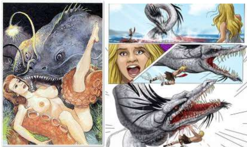
Figuras 3 y 4. Mujer devorada por el monstruo marino y mujer salvada por el héroe que lucha contra el monstruo 2 .

En los comics, con un 6% de representación, se muestra una imagen del mito con tintes más sexuales y en ocasiones crueles, donde aparecen mujeres desnudas siendo literalmente devoradas por monstruos marinos (Fig. 3). Las referencias iconográficas a las cadenas ha desaparecido, sin embargo Perseo es representado en 2 de las 4 imágenes clasificadas en comic (la chica es rescatada por un héroe) (Fig. 4). De los tres elementos iconográfico ha desaparecido uno, las cadenas, la mujer no aparece encadenada, pero si literalmente devorada. El mito está muy sexualizado ofrece una imagen morbosa de una mujer devorada por un monstruo que sale del mar en la mitad de las imágenes y en la otra mitad la mujer es rescatada por el héroe. La mujer se muestra como un mero objeto sexual, bien a merced del monstruo marino o bien salvada por el hombre (héroe).