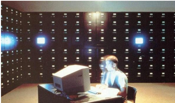
Imagen 1. Antoni Muntadas (1994). The File Room . [Instalación en el Chicago Cultural Center, Estados Unidos].

de bibliotecas públicas, lo cual sitúa al archivo de Muntadas en un lugar a medio camino entre un espacio de acceso público y un espacio museístico, es decir, en un lugar de memoria colectiva. Como apunta el propio artista en una entrevista realizada a propósito de su proyecto Des/Aparicions (2011) en el edificio de Santa Mònica del barrio del Raval en Barcelona, en el que incluye The File Room , es importante la materilización de este tipo de proyectos y ligarlos al lugar bajo la idea de hacer hablar a las paredes a través de la memoria almacenada en el espacio (Ortuño Mengual y Lapeña Gallego, 2019). La sala se encuentra tenuemente iluminada, con las paredes repletas de cajones de archivador y monitores que permiten al espectador/usuario realizar las consultas. La aportación in situ de nuevas entradas se efectúa desde un pupitre con otro ordenador situado el centro de la habitación. Esta primera instalación ha sido posteriormente expuesta en Lyon (1995), París (1996), Barcelona (1996) y Hamburgo (1996), y se ha presentado en Medienbiennale (Leipzig, 1994), Ars Electronica (Linz, 1995), ISEA (Montreal, 1995), entre otros.