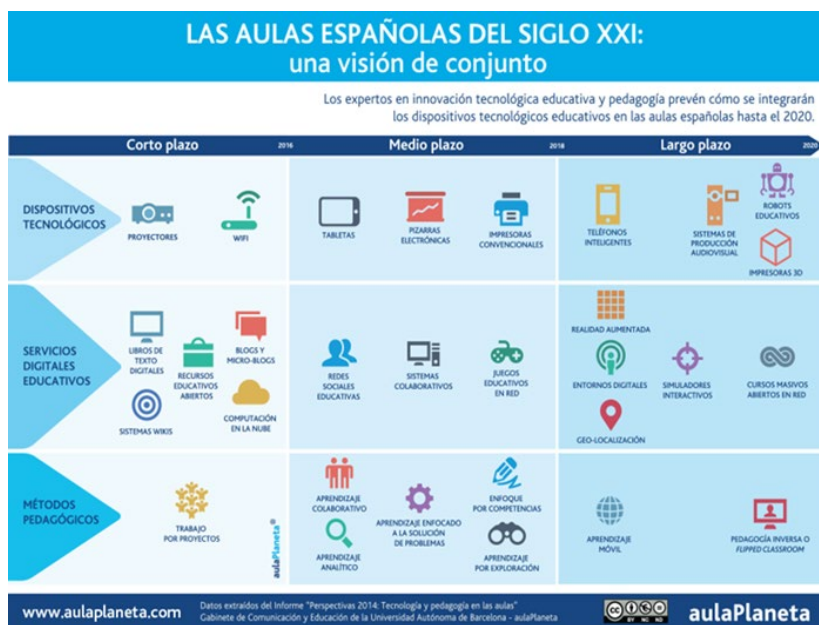
Figura 3: Aulas españolas el siglo XXI

Pérez Tornero y Pi (2014) vaticinan el desplazamiento de la pedagogía hacia el alumno. Si en 2016 el trabajo por proyectos colmaba la actuación docente hacia el trabajo colaborativo, en 2017 ese aprendizaje colaborativo se está desplazando al enfoque pedagógico por competencias que conllevaría a un aprendizaje analítico enfocado a la exploración y solución de problemas. Vaticina asimismo la tendencia futura al aprendizaje móvil y hacia la pedagogía inversa o flipped classroom . Los estudiantes después de clase gestionan el contenido que utilizan, su ritmo y su estilo de aprendizaje.