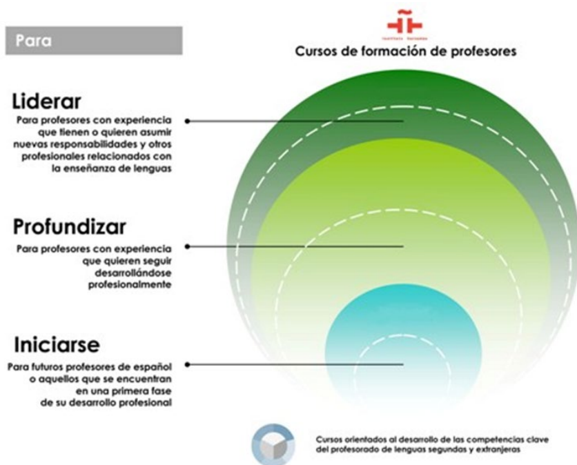
Figura 1: Cursos según la finalidad

Durante el año 2017 se establecen las perspectivas hacia dónde camina la formación actual del profesor de español. En los cursos para iniciarse, además de ofrecer los llamados cursos de larga duración indispensables para comenzar a ser profesor (se ofrecen cuatro cursos: “Lengua y Comunicación”, “Qué significa hablar y aprender una lengua”, “Cómo se aprende y se enseñan una lengua extranjera” y “Qué es ser profesor de lenguas extranjeras”), se visualiza la orientación que debe tener la profesión en primera instancia: los aspectos gramaticales del nivel A y B, la didáctica de la comprensión auditiva, la integración del aprendizaje móvil en la clase de ELE y la mediación lingüística en el aula de ELE. Una vez sintetizados los recursos indispensables, la profundización debe seguir las siguientes líneas: la enseñanza de ELE a niños de 7 a 12 años y a adolescentes y aspectos como dinámicas de juego en el aula, la producción oral y sus técnicas de retroalimentación y las claves para escribir y publicar artículos de investigación. Existe además una clara orientación hacia el aprovechamiento de las TIC: acreditación de tutores de AVE Global, diseño de cursos semipresenciales y creación de espacios y materiales de enseñanza en línea.