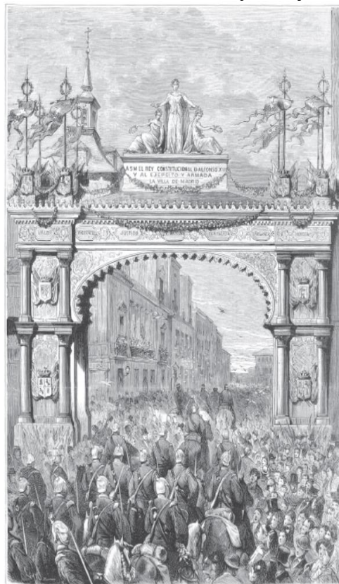
ARCO BARRIO A ENTRADA DEL EJERCITO, AYUNTAMIENTO, JUNIO A LA PLAZA DE LA VILLA.

Figura 1. Arco de la Calle Mayor. Litografía.