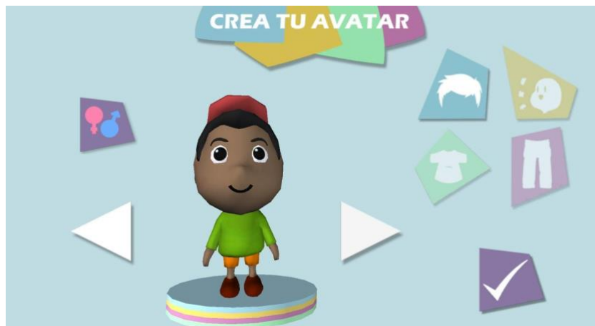
Figura 2. Menú de creación de avatar personalizable de la aplicación TEAPP.

El grado de personalización, uno de los últimos aspectos evaluados, resulta relevante desde el punto de vista de adaptación del usuario. Los niños y niñas con TEA, al igual que sus iguales en infantil, tienen características bien diferentes entre ellos, por lo que las opciones de personalización permitirán un mayor o menor grado de adaptación de la aplicación. En este caso, únicamente TEAPP incluía avatares personalizables (figura 2), elemento motivador para los más pequeños, y únicamente dos aplicaciones, el organizador Día a Día y el comunicador PictoTEA permiten la personalización del contenido mediante el uso de imágenes y vídeos propios.