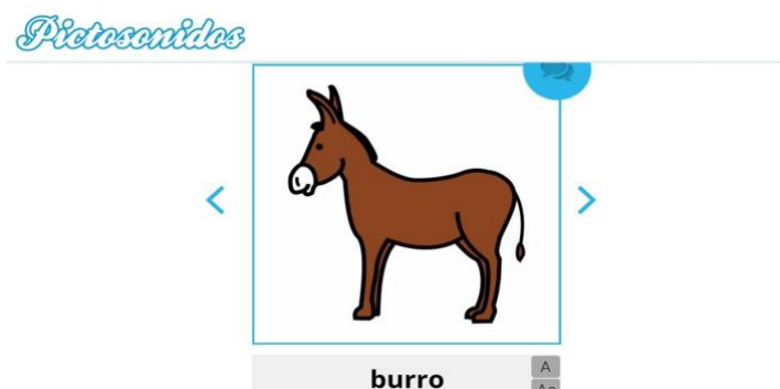
Figura 1. Uso de pictogramas y narración en la aplicación PictoSonidos.

En relación con la dimensión de diseño, en líneas generales, las aplicaciones presentan una interfaz intuitiva, así como iconos representativos del concepto al que hacen referencia en sus botones. Los menús son pertinentes, suelen registrar aquellas características relacionadas con la categoría general en la que se encuentran. Integran sonidos e imágenes de buena calidad, aspecto en el que destaca la app TEAPP , ya que contiene representaciones 3D tanto de los avatares como del mundo por el que han de desplazarse los usuarios. La mayoría de aplicaciones hacen uso de pictogramas, algunos de ellos utilizan pictogramas de creación propia, como es el caso de Jade Autism , Día a día o #Soyvisual , mientras que otras como PictoSonidos o PictoTEA emplean los del portal ARASAAC 1 (figura 1).