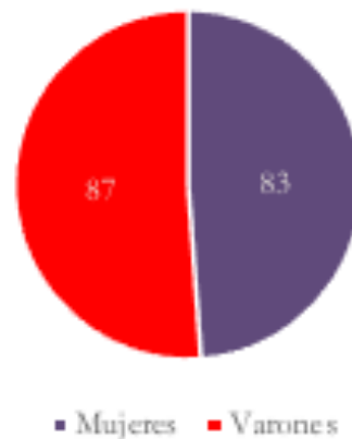
GRÁFICO 1. – Distribución de la muestra según sexo.

Con ese dato y a la visita de la información producida a través de los cuestionarios y otros procedimientos indirectos, hemos definido una muestra compuesta por un total de 170 personas: 49% de mujeres frente a 51% de varones, adscritos a veintitrés centros (de