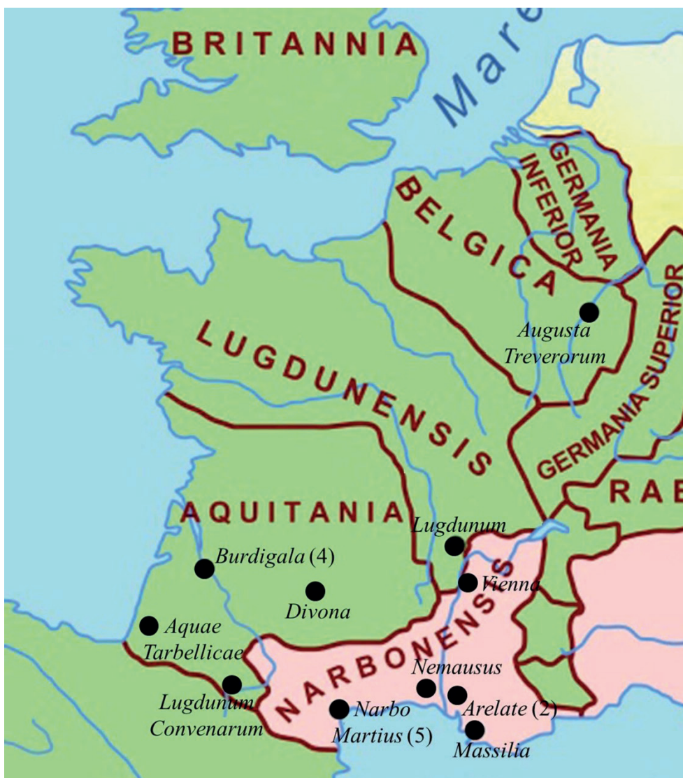
Figura 2. Centros de destino de los personajes estudiados

de comunicación terrestre ( Aquae Tarbellicae ), marítima ( Massalia ) o fluvial ( Nemausus , Arelate y Vienna ), circunstancias que favorecieron el desarrollo económico de estos centros urbanos, convirtiéndolos en lugares atractivos para la población foránea. En cambio, las provincias galas más alejadas recibieron a pocos hispanos, puesto que solo hemos documentado un caso en la Lugdunensis , en cuya capital falleció el [B]arcianen(s)is [---] Cassius , y otro en la Gallia Belgica , donde estuvo destinado el eques T. Lucretius A[---] .