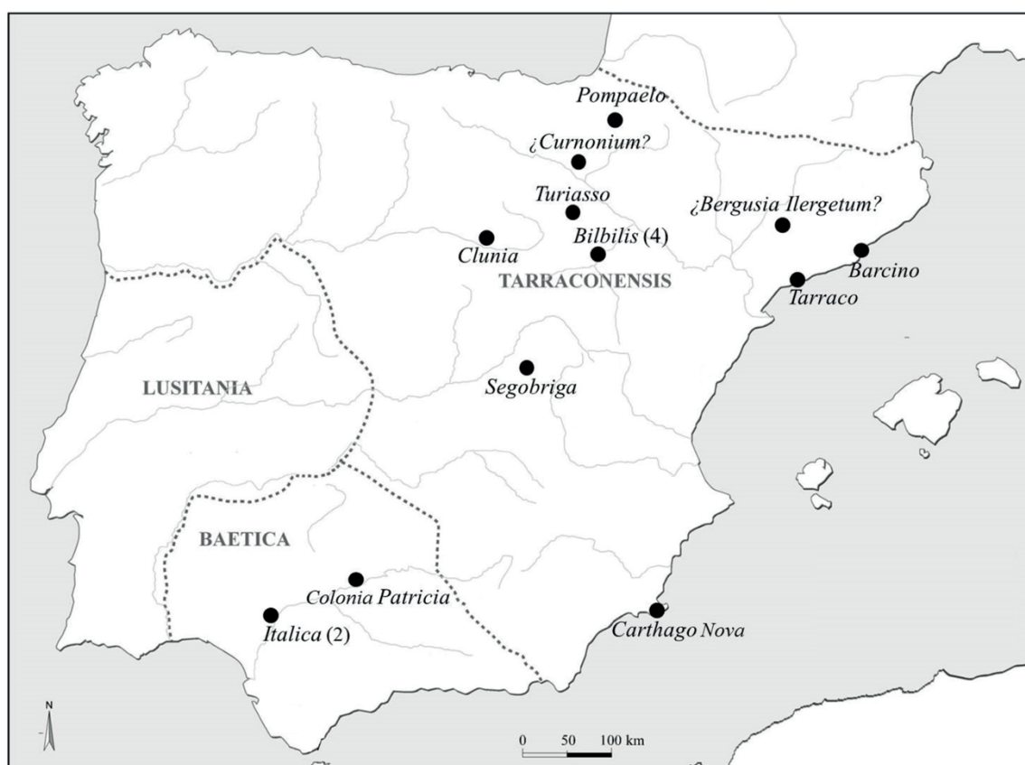
Figura 1. Ciudades de origen de los personajes estudiados

La documentación epigráfica estudiada constata la presencia en la Gallia de 19 hispanos. Desde un punto de vista geográfico la mayoría de las inscripciones analizadas aluden a individuos procedentes de la Citerior (13 de los 19 casos estudiados, un 68,42 % de la muestra reunida), destacando particularmente el caso de Bilbilis , que aporta cuatro personajes a este trabajo (figura 1). Conviene reseñar igualmente que la mayoría de las ciudades de origen documentadas en esta provincia – Bilbilis , Turiasso , Pompaelo , Clunia , Bergusia , Tarraco o Barcino – se sitúan en su cuadrante noreste, en conventus fronterizos con la Gallia a través de los Pirineos. En contraste, la aportación de la Betica y de Lusitania , provincias geográficamente más alejadas de la Gallia , es mucho menor, puesto que la primera aporta tres individuos –dos de Italica y uno de Corduba – y la segunda tan solo uno, T. Sextus Manlius , que indicó su origen con el étnico Lusitanus . A estos casos debemos añadir los de Q. Vettius Gracilis (Natione Hispania) y Gregorius (Hispana natus) , que señalaron su procedencia mediante una referencia genérica a Hispania .