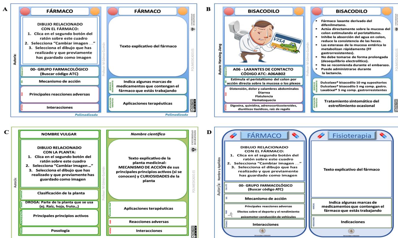
Figura 1. Plantillas creadas en Power-Point para realizar las flashcards . (A). Anverso y reverso de la plantilla de la flashcard . (B). Flashcard del bisacodilo elaborada por una alumna de Grado. (C). Plantilla utilizada para la elaboración de las Fitocards . (D). Adaptación de la plantilla de la flashcard elaborada por profesores de Farmacología de la Universidad de Valladolid.

Uno de los atributos clave de las flashcards es su capacidad para apoyar técnicas de memoria, un aspecto que en nuestro proyecto se potencia en el apartado de las imágenes. Proponemos usar representaciones gráficas que dejen huella en la persona que las vea, que sean fáciles de recordar y que, en combinación con ciertas reglas mnemotécnicas, ayuden a memorizar el nombre del fármaco y algunas de sus características esenciales (memoria visual). Estos recursos didácticos se utilizan en asignaturas relacionadas con la Farmacología, un campo de suma relevancia para los estudiantes de grados biosanitarios. Los medicamentos son productos que requieren seriedad, relacionados con la enfermedad y el sufrimiento de pacientes en muchos casos, y no deben ser trivializados. Por este motivo, los docentes involucrados en este proyecto tienen opiniones divergentes acerca del tipo de imágenes que se deben emplear. Por un lado, algunos consideran que cualquier imagen (siempre y cuando no sea ofensiva en ningún aspecto) es apropiada si facilita el aprendizaje de los estudiantes (Figura 1B y Figura 2). Por otro lado, otros sostienen que la Farmacología es una disciplina científica rigurosa que no debería ser simplificada o reducida a imágenes demasiado básicas o infantiles. Aunque los principales textos de Farmacología emplean esquemas y figuras para facilitar la comprensión de los mecanismos de acción y otros aspectos científicos, las ilustraciones propuestas en esta actividad son