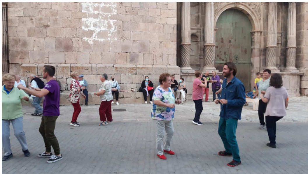
Figura 1. Jornadas “Las personas y los patrimonios”. Baile tradicional de jota y fandango con música en directo de las rondallas de Penyagolosa. 02 de julio 2022.

El Convenio Marco del Consejo de Europa sobre el valor del patrimonio para la sociedad, conocido como Convenio de Faro por la ciudad portuguesa en la que se firmó en 2005, reconoce el derecho de toda persona a “establecer vínculos con el patrimonio cultural de su elección, respetando los derechos y libertades de los demás” (Preámbulo. Convenio de Faro).