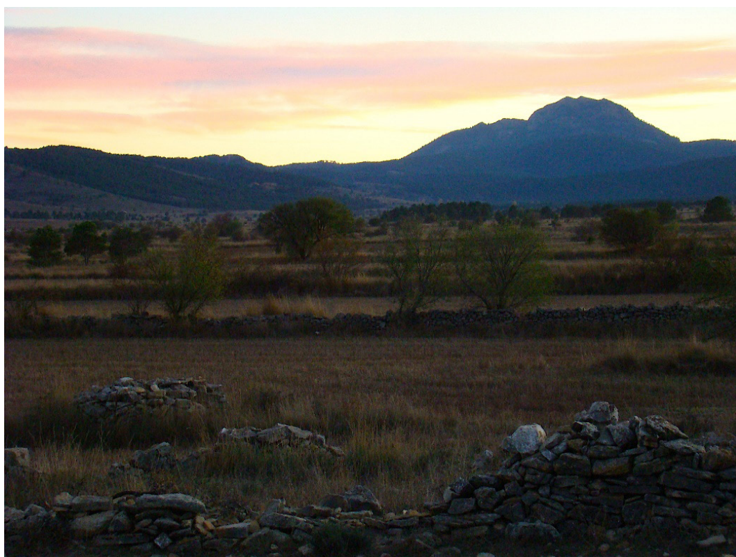
Figura 3. El pico de Penyagolosa visto desde los bancales del Pla de Vistabella. 05 de noviembre de 2013. Autora: Elvira Safont

La puesta en valor de la personalidad cultural y el fomento de la autoestima de este territorio estarían en la base de esta comunidad patrimonial que se intenta generar con los habitantes residentes, pero que cuenta con una importante aportación de población flotante: en el siglo XXI la mejora de las comunicaciones devuelve cada fin de semana al territorio una parte de pobladores expulsados que desarrollan su actividad profesional en la línea de costa pero que mantienen lazos afectivos, culturales y económicos con su lugar de origen.