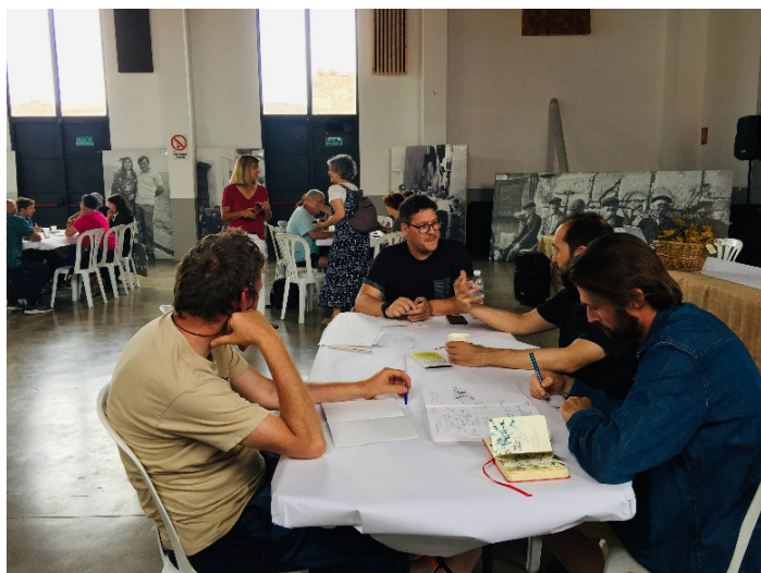
Figura 6. Jornadas “las personas y los patrimonios”. Talleres temáticos de debate. 3 de julio de 2022.

Para esta segunda reunión se toma como modelo el ecomuseo LaPonte de Villanueva de Santo Adriano (Asturias). En un ecomuseo las paredes del museo son el territorio. Las piezas expuestas son los patrimonios. Los visitantes son los vecinos y vecinas que habitan los territorios. Este punto de partida plantea una verdadera innovación social patrimonial respecto al papel y legitimidad de la ciudadanía para organizarse y plantear acciones en su territorio.