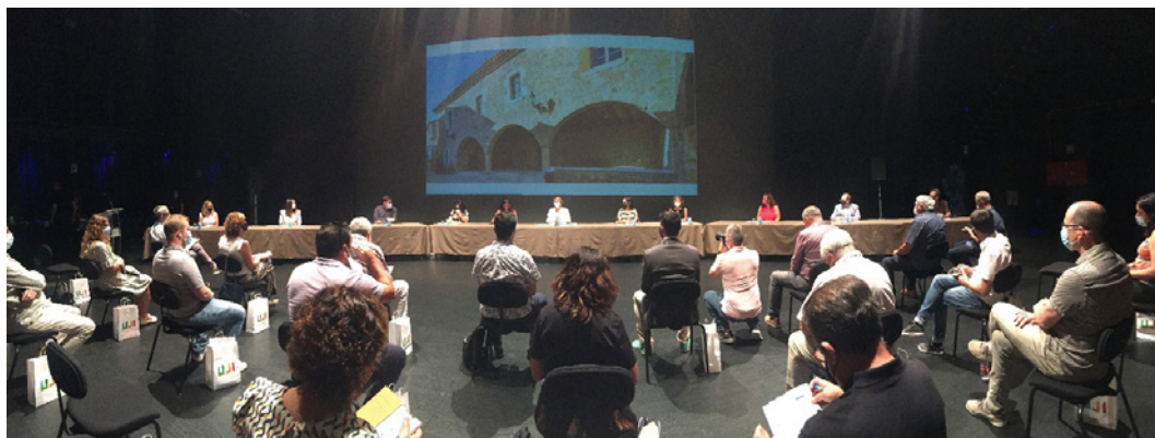
Figura 4. Firma de convenio ENCLAU_UJI entre el Ayuntamiento de Vistabella y la Universitat Jaume I. Julio de 2021.

El resultado de este acompañamiento es una propuesta elaborada entre el PEU de la UJI y el CEP para crear una comunidad patrimonial participativa, con origen en Vistabella del Maestrat pero con la voluntad de ampliación a la Mancomunitat de Penyagolosa, que se acaba de constituir de manera oficial. Se eleva la iniciativa tanto a la Universitat Jaume I como al Ayuntamiento de Vistabella del Maestrat, y ambas instituciones firman el convenio de colaboración ENCLAU_UJI para el desarrollo de proyectos culturales.