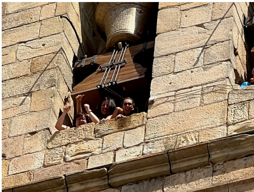
Figura 9. Proyecto “Campanes de Penyagolosa”: Toque manual de campanas con participación ciudadana. 26 de agosto de 2022.

El domingo 3 de julio, las Jornadas comenzaron con una visita cultural en la que se realizó un recorrido por el casco antiguo de Vistabella del Maestrat y la participación en el toque manual de campanas en el campanario del municipio. La última parte de las Jornadas fueron los talleres temáticos en los que las personas participantes estuvieron trabajando con los ponentes, formas de aterrizar los contenidos tratados y vías para aprovechar las experiencias en la construcción colectiva de la comunidad patrimonial de Penyagolosa.