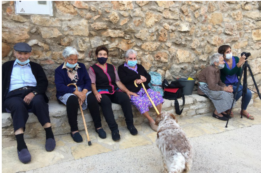
Figura 10. Plaza del Hospital. Vistabella del Maestrat. Proyecto de memoria oral “Les Veus de Penyagolosa”. 2020.

a su administración, y del cual ellos son una parte, porque vehicula una línea cultural muy coherente y enraizada en los valores identitarios del territorio. Por otro lado, la iniciativa ha puesto en contacto a personas que tenían proyectos personales que se han sumado a la idea colectiva.