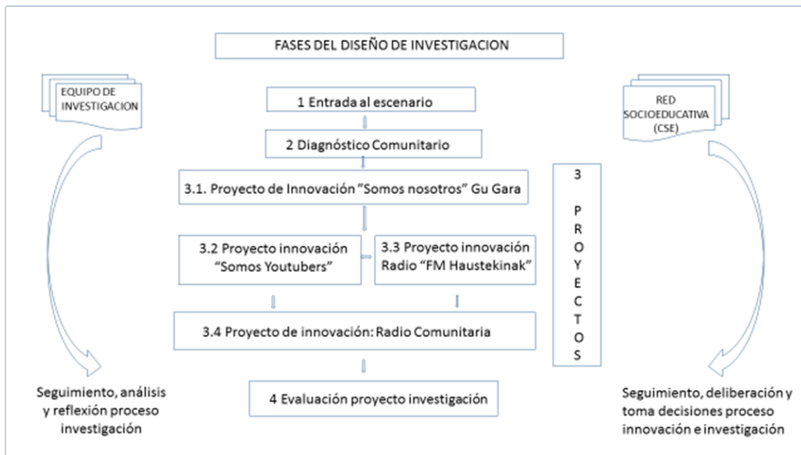
Figura 1. Fases del diseño de la investigación.