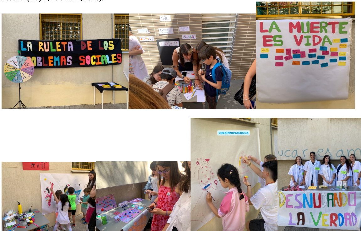
Figure 2. Images of the development of the activities proposed by the students for the participants in the CreainnovaEduca Festival (May 9, 10 and 11, 2023).

These projects were carried out at the CreainnovaEduca Festival on May 9, 10 and 11, 2013. A total of 16 groups of children and adolescents from different schools in the province of Granada, from kindergarten to high school, were received, with the participation of students with special educational needs. The reception of the diversity present in the children who came to the festival was a challenge for the creation of socio-educational activities, which meant planning and making adaptations for specific groups (different ages, children with autism spectrum disorder, etc.). Throughout the days of the Festival, the different groups were organized to intervene in a fair format and to dynamize the visit of these educational centers to our faculty. Attached is graphic evidence of the development and final products of the activities carried out. We have the necessary permissions for the use of the images for academic and teaching use by the UGR.