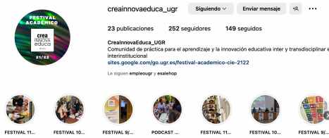
Figure 4. Instagram account where the events of our students' activities and workshops have been disseminated.

- Dissemination in congresses and events on university teaching. The design and development of the teaching innovation project has been presented at the i-DEA International Congress on Didactic Research and Advanced Curricular Studies for Education and Citizenship; also at the Forum on Teaching Innovation of the UGR and next June 7, 2023 the results will be presented at the II Conference on Innovation in Education organized at the Faculty of Education Sciences. Evidence is attached.