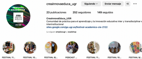
Figura 4. Cuenta de Instagram dónde se ha divulgado lo acontecido en las actividades y talleres de nuestro alumnado

- Divulgación en congresos y eventos sobre docencia universitaria. Se ha presentado el diseño y desarrollo del proyecto de innovación docente en el Congreso Internacional i-DEA de Investigación Didáctica y Estudios Curriculares Avanzados para la Educación y la Ciudadanía; también en el Foro de Innovación Docente de la UGR y el próximo 7 de junio de 2023 se expondrán los resultados en las II Jornadas en Innovación en Educación organizadas en la Facultad de Ciencias de la Educación. Se adjuntan evidencias.