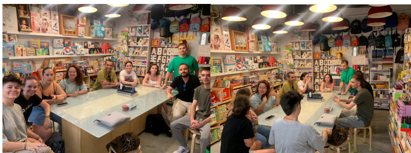
Figura 1. Imágenes de los estudiantes de una sesión dedicada a la creatividad y elaboración de materiales para sus actividades