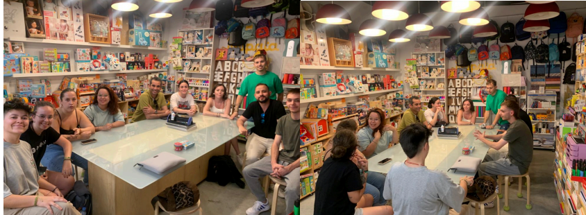
Figure 1. Images of students from a session dedicated to creativity and elaboration of materials for their activities.

These projects were carried out at the CreainnovaEduca Festival on May 9, 10 and 11, 2013. A total of 16 groups of children and adolescents from different schools in the province of Granada, from kindergarten to high school, were received, with the participation of students with special educational needs. The reception of the diversity present in the children who came to the festival was a challenge for the creation of socio-educational activities, which meant planning and making adaptations for specific groups (different ages, children with autism spectrum disorder, etc.). Throughout the days of the Festival, the different groups were organized to intervene in a fair format and to dynamize the visit of these educational centers to our faculty. Attached is graphic evidence of the development and final products of the activities carried out. We have the necessary permissions for the use of the images for academic and teaching use by the UGR.