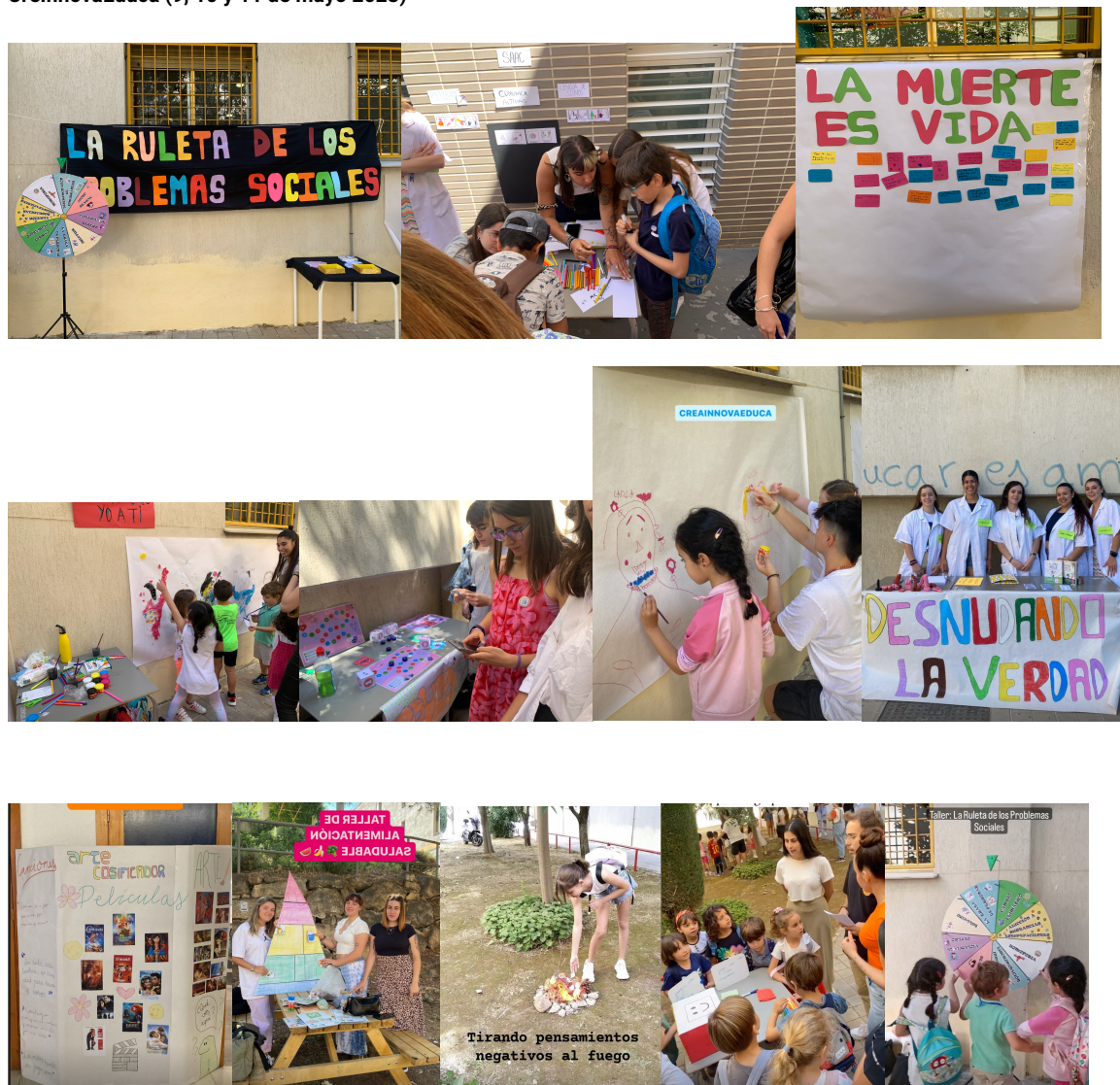
Figura 2. Imágenes del desarrollo de las actividades propuestas por el estudiantado para los participantes en el Festival CreainnovaEduca (9, 10 y 11 de mayo 2023)

Estos proyectos se ejecutaron en el Festival CreainnovaEduca los días 9, 10 y 11 de mayo de 2013. En total se recibieron 16 grupos de niños, niñas y adolescentes de diferentes centros educativos de la provincia de Granada, de la etapa de educación infantil a secundaria, contando además con la participación de estudiantes con necesidades educativas especiales. La acogida de la diversidad presente en los niños que vinieron al festival supuso un reto para la creación de las actividades socioeducativas, lo cual supuso planificar y realizar adaptaciones para colectivos específicos (diversas edades, niños con trastorno del espectro autista, etc.). A lo largo de los días del Festival se organizaron los diferentes grupos para intervenir en formato feria y dinamizar así la visita de estos centros educativos a nuestra facultad. Se adjuntan evidencias gráficas del desarrollo y productos finales de las actividades realizadas. Se cuenta con los permisos necesarios para la utilización de las imágenes para uso académico y docente por parte de la UGR.