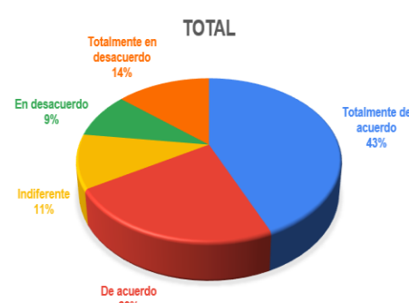
Gráfico 2. Crees que la forma de analizar los contenidos te puede servir en otras materias