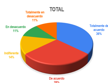
Gráfico 3. Crees que has entendido mejor los conceptos que en una clase magistral