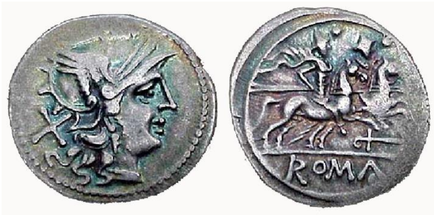
ANCLA 211 - 208