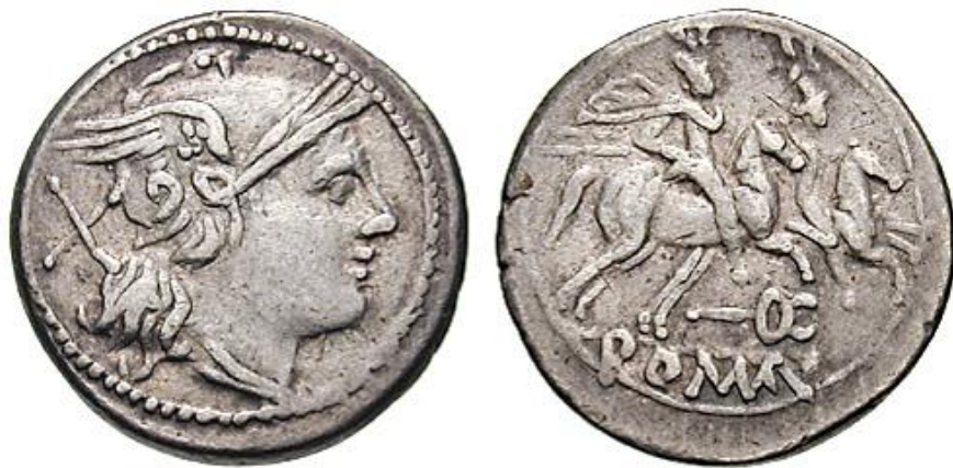
CADUCEO 211 - 208