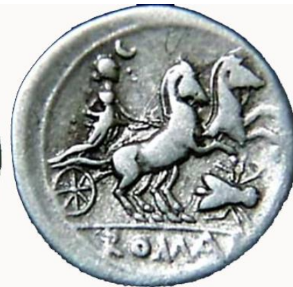
ROMA / DIANA EN BIGA Y MOSCA. (179-170)