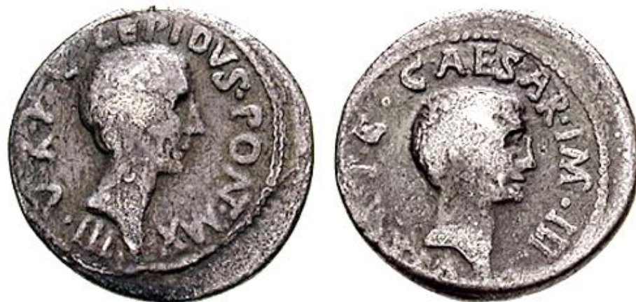
Lépidus y Octavio