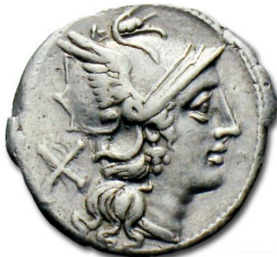
ROMA / VICTORIA EN BIGA