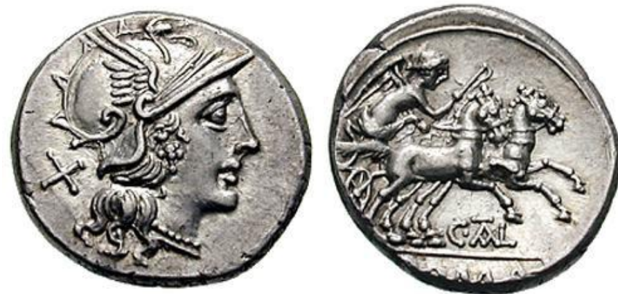
CAIUS THALNA ( C·THAL ) (154 a.C.)