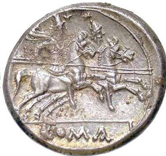
ROMA / DIÓSCUROS