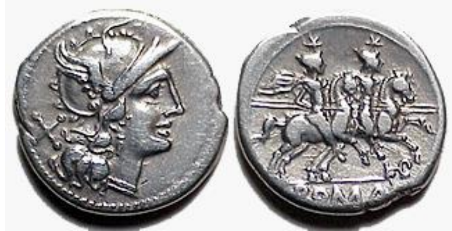
LUCIUS PLAUTUS HYPSSAEUS ( LPLH ) (194-190 a.C.)