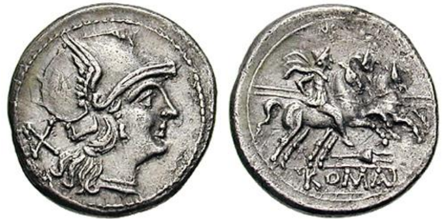
ÁPEX 211 - 208