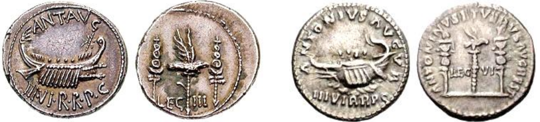
Denarios legionarios de Marco Antonio