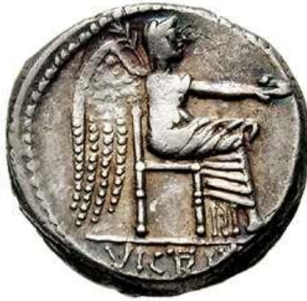
Marco Porcio Catón. 89 a.C.