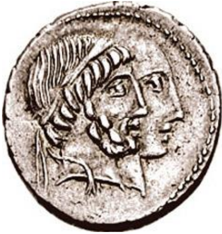
Denario de C. Marcio Censorino con Numa Pompilio y Anco Marcio. 88 a.C.