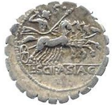
Lucio Cornelio Escipión Asiageno 106 a.C.