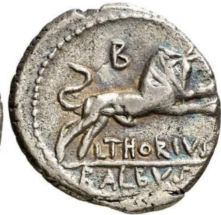
Lucius Thorius Balbus. 105 a.C.