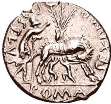
SEXTUS POMPEIUS FOSTLUS