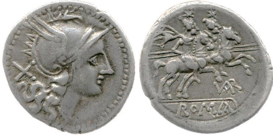
MARCUS TERENTIUS VARRO ( VAR ) (206-200 a.C.)