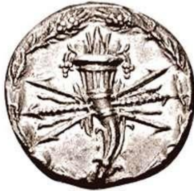
Quinto Fabio Máximo. 127 a.C.