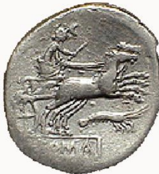
ROMA / DIANA EN BIGA Y GAMBA. (179-170)