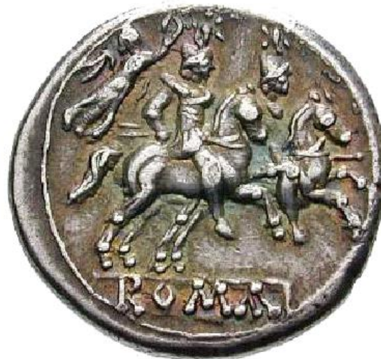
VICTORIA CORONANDO DIÓSCUROS (211-208)