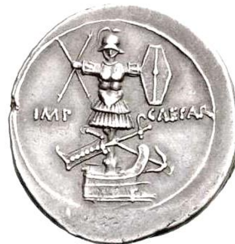
JULIO CÉSAR (46-45 a.C.)