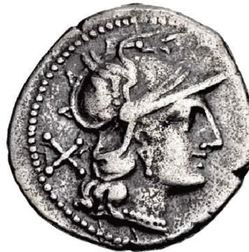
SX.Q = SEXTUS QUINTILUS (189-180 a.C.)