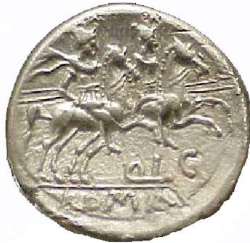
Q L C QUINTUS LUTATIUS CATULUS o CERCUS (206-200 a.C.)