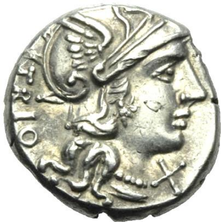
CNAEUS LUCRETIUS TRIO 136 a.C.