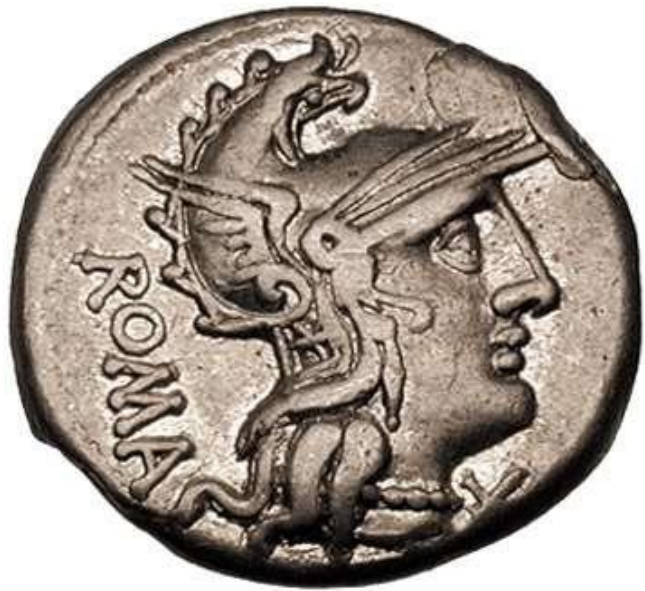
CAIUS CAECILIUS METELLUS (125 a.C.)