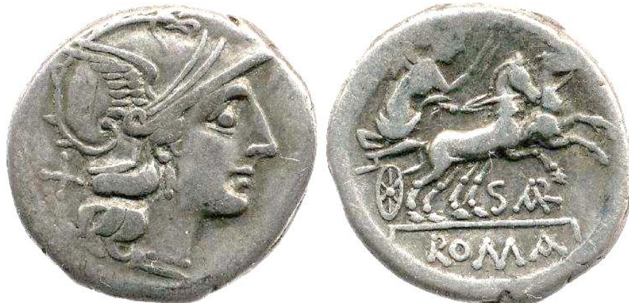
ATILIUS SARANUS ( SAR ) (155 a.C.)