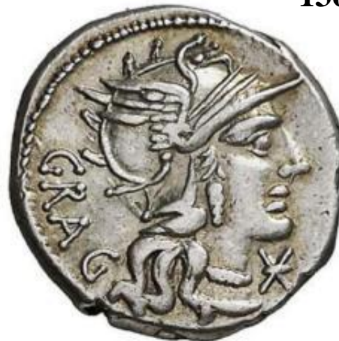
LUCIUS ANTESTIUS GRAGULUS 136 a.C.