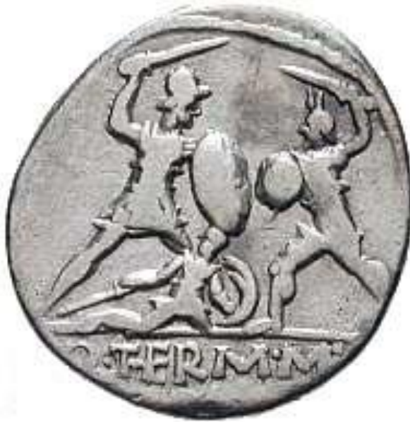
QUINTUS MINUCIUS THERMUS (103 a.C.)