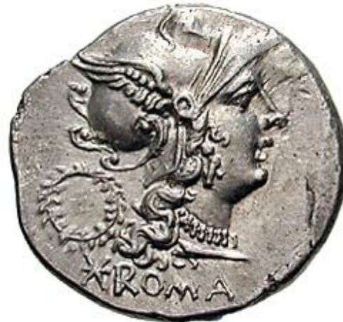
CAIUS SERVEILIUS 136 a.C.