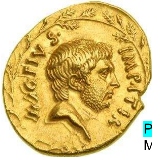
POMPEYO MAG PIVS IMP ITER