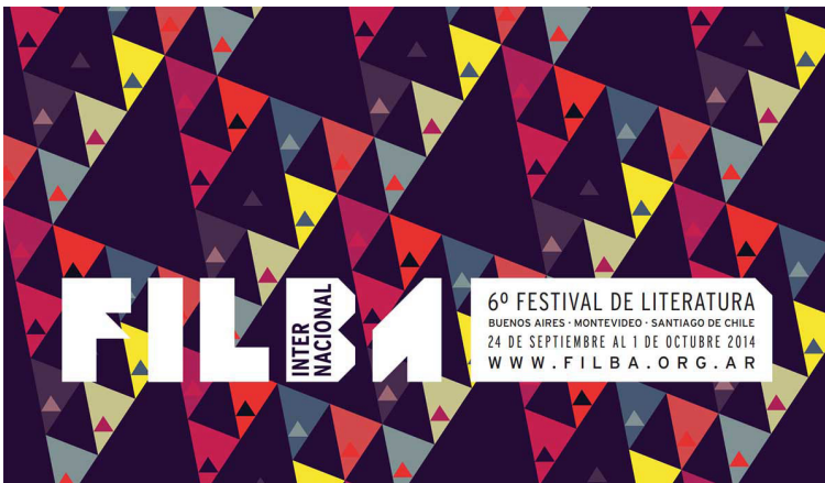
Figura 1: cartel Filba Internacional de Buenos Aires 2014.

Nos encontramos entonces con un festival performativo donde se escenifican ciertos tropos de la memoria y símbolos nacionales, estéticos y políticos, en detrimento de otros. De este modo, los temas que más se han repetido en los bloques que se mantienen fijos cada año (Tinta activa, En primera persona, Lado B, Talleres, Filba barrio, Filba noche) han sido los siguientes: la vinculación entre la literatura y el espacio urbano de Buenos Aires 18 ; el uso de la crónica, destacado en la tradición argentina desde Arlt y Walsh a María Moreno; el giro subjetivo; el tema del cuerpo y la enfermedad; el concepto de literatura como resistencia/salvación o la presencia en tres ocasiones de actividades relacionadas con el grupo Oulipo, que refuerza el peso de la vanguardia histórica en el campo argentino. Incluso los mismos afiches del Filba tienen un diseño que recrea las formas rectas y los colores primarios del arte vanguardista: