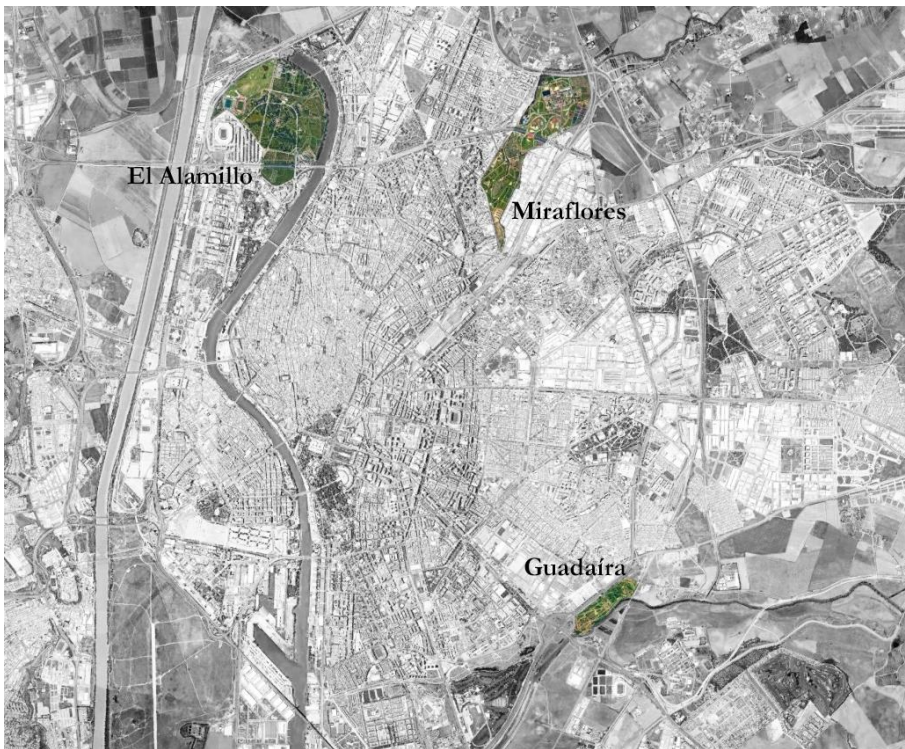
Figura 2: Localización y superficie de los parques urbanos en los bordes de la ciudad de Sevilla seleccionados como casos de estudio, 2021. (Elaboración propia sobre base PNOA).

Sin embargo, al contrario que los parques periurbanos, estos espacios se encuentran en suelo urbano y están regulados directamente por el planeamiento municipal. Suelen tener, al menos en los casos del área metropolitana de Sevilla (fig. 2), una mayor superficie, y no cuentan con ningún tipo de protección más allá de la urbanística, ni por sus valores ambientales ni por los culturales, salvo aquellos elementos de especial interés que hayan sido incluidos en el Inventario de Bienes Reconocidos del Patrimonio Histórico Andaluz o, más excepcionalmente, en el Catálogo General del Patrimonio Histórico Andaluz. A pesar de ello, buena parte de las actividades se desarrollan en o entorno a estos elementos, aunque no siempre han recibido el adecuado tratamiento o han sido puestos en valor.