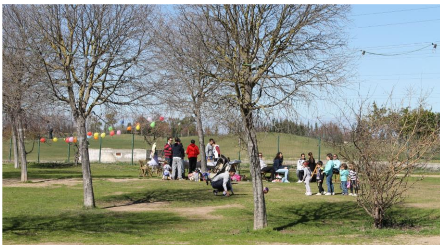
Figura 4: Parque del Alamillo, topografía y uso recreativo, 2014. (Fotografía de los autores).

Ello explica su diseño paisajístico (fig. 4), con distintas topografías, caminos y elementos creados ex novo , como las superficies de agua, en torno a las cuales se combinan masas vegetales representativas de los diferentes ecosistemas del Mediterráneo. Las únicas preexistencias serían algunas parcelas cultivadas con naranjos y el mencionado bosque galería, así como la calle central del parque, que sigue el trazado del antiguo camino rural que atravesaba los terrenos de La Cartuja y los comunicaba con Sevilla a través del barrio de Triana. De hecho, no existen más elementos patrimoniales de interés al margen de su valor histórico, ya que las huertas del Alamillo y el paraje formado por la vega del Guadalquivir son citadas por algunos autores del siglo de Oro, como Miguel de Cervantes, Lope de Vega o Luis Vélez de Guevara. El propio cortijo del Alamillo es una construcción levantada entre los años cincuenta y sesenta, mientras que los últimos vestigios del antiguo caserío, destruidos en la década de los ochenta durante las obras de la Expo '92, no tenían especiales valores arquitectónicos, aunque sí etnográficos 28 . Aun así, el largo y rico pasado de este predio, que ha cambiado de manos y de usos durante siglos, y su relación con otros lugares de especial valor patrimonial, como el monasterio de La Cartuja, el monasterio de San Jerónimo o la vega de Triana, contribuyen a la comprensión de este espacio periférico y su estrecha relación con la ciudad histórica.