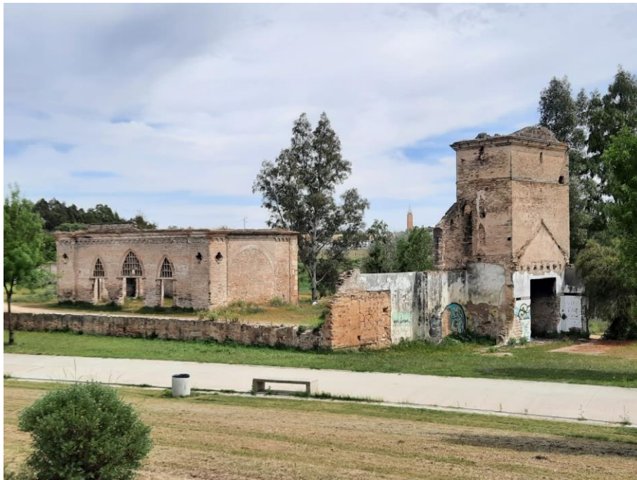
Figura 5: Molino de Teatinos en el Parque del Guadaira, 2021..

metros aguas arriba, o los restos de los caminos históricos, algunos de los cuales podrían haber perpetuado también el trazado de la antigua calzada romana 33 .