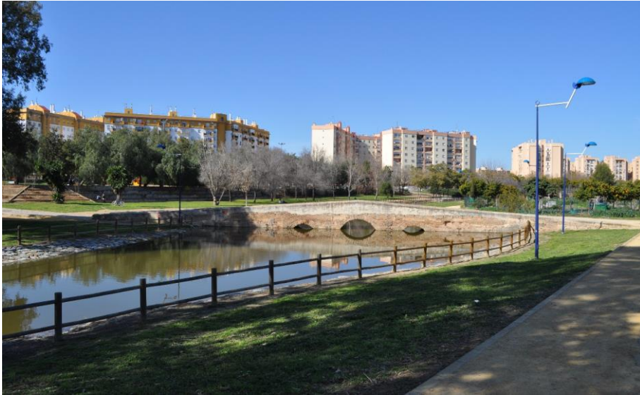
Figura 3: Parque Miraflores, con el arroyo Tagarete y el puente del siglo XVIII , 2015. (Fotografía de los autores).

de La Albarrana, y toda la red de caminos e infraestructuras viarias entre las que sobresale un puente del siglo XVIII (fig. 3), recientemente restaurado 26 .