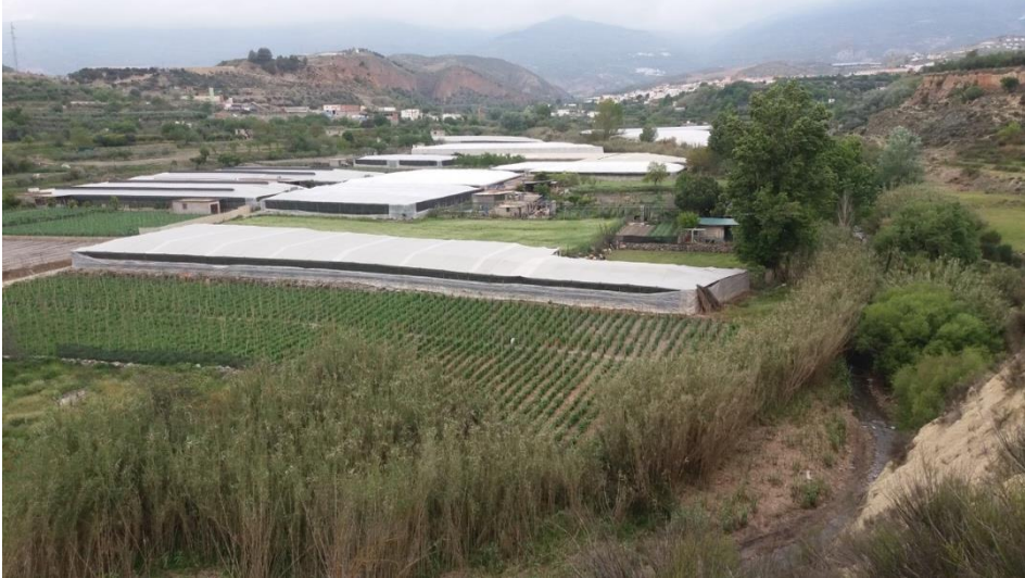
Figura 2: Juan Luis Fernández-Quero, Ubicación de invernaderos respecto al caudal ordinario del río en primavera en el municipio de Ugíjar.

LOUA. Preocupa la extensión de invernaderos muy próximos al cauce de máxima crecida ordinaria (fig. 2), algo que se está extendiendo a otros municipios.