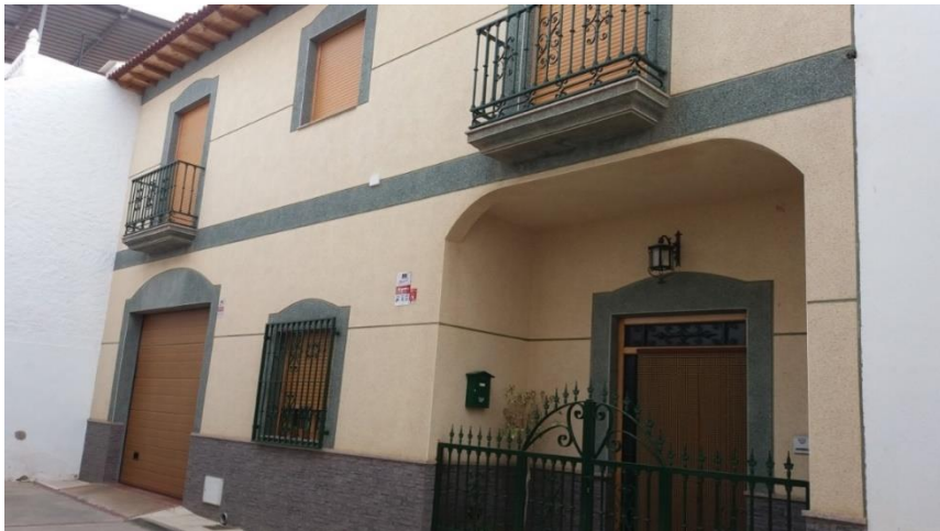
Figura 3: Juan Luis Fernández-Quero, Casa popular de la Alpujarra interior con fachada de coloración amarilla y azul a base de una monocapa de mortero con piedra proyectada.

Por otra parte, si ya se evidencian errores de bulto en las zonas culturales protegidas de la Alpujarra que se podrá esperar en aquellas que no están bajo esta figura, a pesar de que las más aisladas han conservado en ocasiones mejor sus características aún sin estar protegidas. Destacar en este aspecto la falta de uniformidad del paisaje urbano. Este es más evidente sobre todo en las zonas sin protección supralocal y con más dinamismo, donde ni siquiera en ocasiones se cumplen las normativas urbanísticas locales, señalar algunas malas praxis por el impacto que producen como la coloración y el tipo de material (fig. 3) o la construcción de nuevos tipos de tejados en las casas populares (fig. 4), entre otros muchos aspectos.