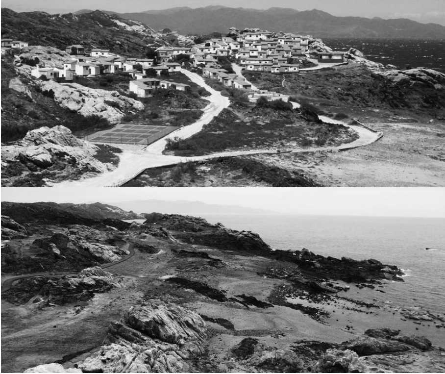
Figura 3: Martí Franch, Ton Ardèvol y Pau Esteve Bosch, vista del Club Mediterrané antes y después de su eliminación ( a+t , n.º 39-40 [2012]: 254-5).

realidad, de ello depende parte importante de la salud del inmediato futuro de nuestro valioso patrimonio paisajístico.