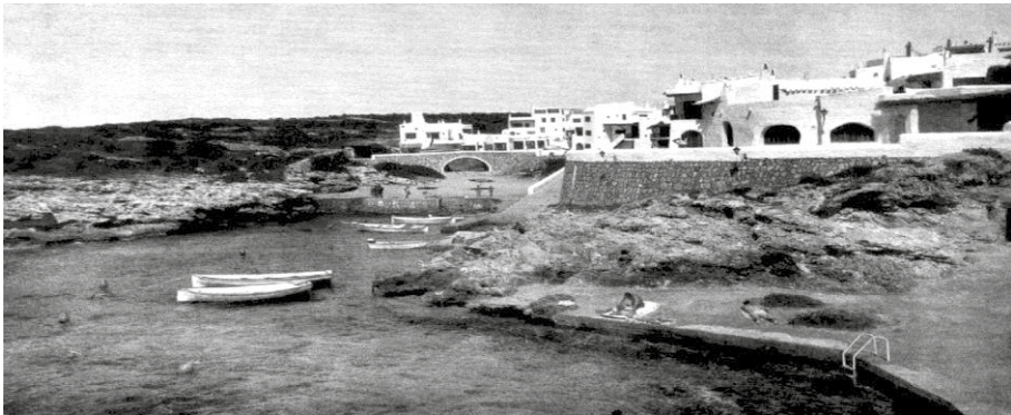
Figura 1: Barba Corsini, Vista de Binibeca Vell ( Informes de la Construcción Vol. 25, n.º 246 [1972])