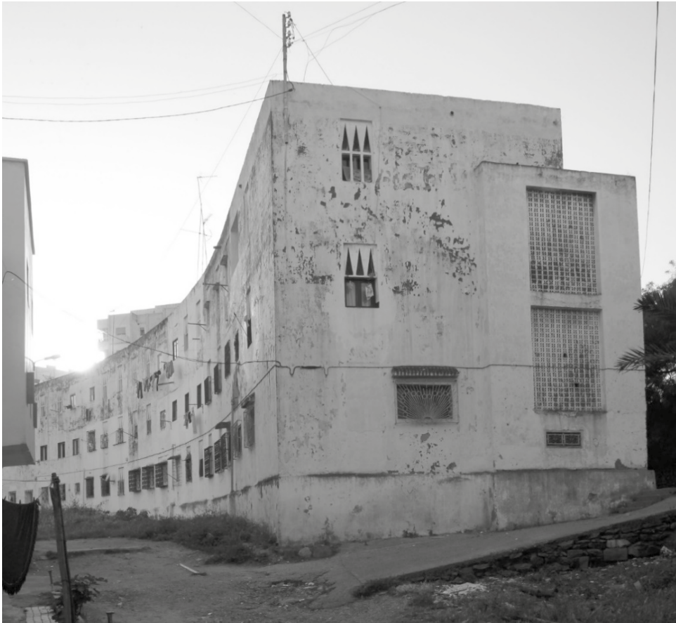
Figura 5: Viviendas económicas para familias humildes "Barriada Muley Hassan" en Tetuán, 1953-55. Arquitecto Alfonso de Sierra Ochoa. Vista general en 2010. (Fondo documental GAMUC.org).

Él mismo se refería a su modelo de barriada como una aportación íntegramente marroquí a la arquitectura contemporánea y la búsqueda de un camino nuevo en el doble campo de la arquitectura y del urbanismo 30 (fig. 5).