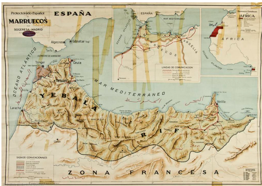
Figura 1: Protectorado Español en Marruecos. Cartografía de 1925. (Fondo Biblioteca Virtual del Patrimonio Bibliográfico).

que realiza, se puede entender la importancia que tuvo su trabajo en la configuración del paisaje actual de la Medina. En segundo lugar, porque la medina de Tetuán constituye uno de los ejemplos de mayor interés, desde el punto de vista arquitectónico y urbanístico, de todo el norte de África, no sólo por la naturaleza y el volumen de su patrimonio edificado, sino porque materializa la unión, de forma particularmente acertada, de la ciudad islámica o medina y la ciudad occidental o ensanche moderno 7 . Y, en tercer y último lugar, porque la intención es obtener ese ideario o método de trabajo teórico que pudiera, a partir del ejemplo tetuaní, ser extensible a otras poblaciones (fig. 1).