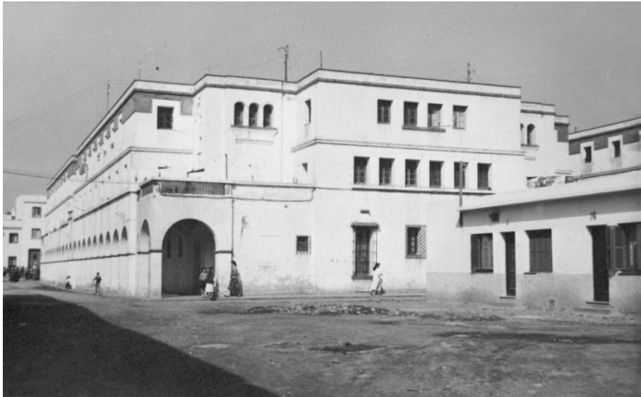
Figura 4: Viviendas para familias humildes “Grupo General Orgaz” en Tetuán, 1941-42. José María Tejero y Benito. (Fondo de Alfonso de Sierra Ochoa. Biblioteca Vicente Aleixandre, Instituto Cervantes de Tetuán.).

emplear procedimientos modernos que representando mayor economía sobre los tradicionales se traduzcan en desventajas higiénicas... con jardinería exterior no tratada a cordel, sino a sentimiento por manchas de colores y volúmenes en contraste con la arquitectura...” 26 .