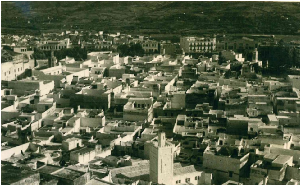
Figura 3: Foto de Tetuán en 1946. (Fondo documental APRSO).

Por último, se han revisado algunas de las numerosas obras desempeñadas como arquitecto privado. Son centenares las viviendas realizadas en el interior de la medina de Tetuán 15 . También realizó otros trabajos esparcidos por todo el territorio del Protectorado, que no quedan aquí recogidos por aportar menos información al tema tratado. Pero sin duda pueden servir para otros estudios 16 (fig. 3).