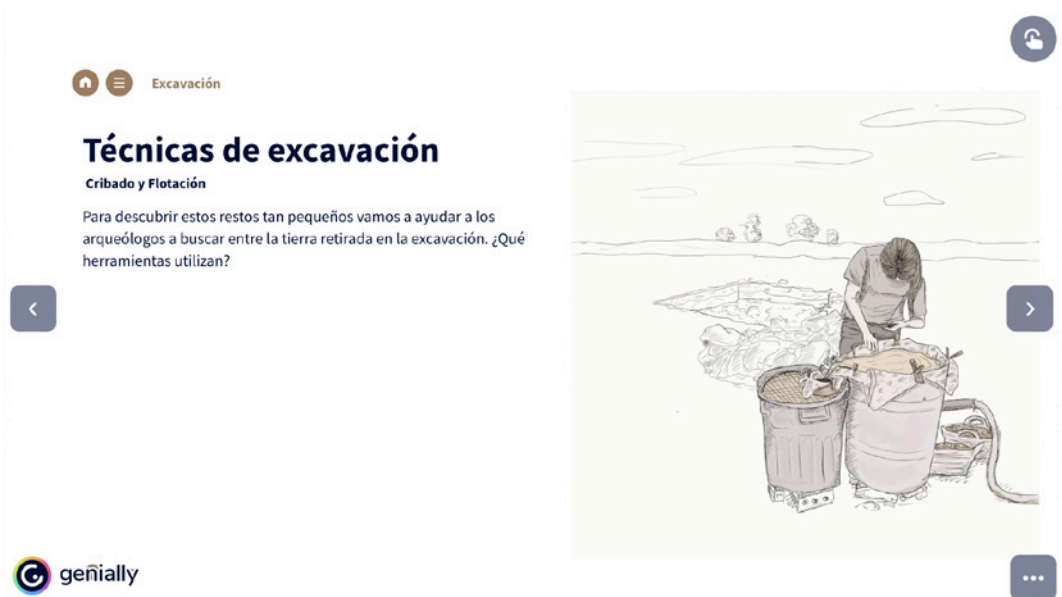
Figura 2. Técnicas de excavación.

Así, en la primera parte se narra el proceso de excavación de campo a través de una serie de ilustraciones que muestran distintas actividades propias de las intervenciones arqueológicas, junto a un texto explicativo y participativo en el que los discentes van a trabajar durante un día con el arqueólogo/a. La trama del texto se desarrolla a partir de la explicación del arqueólogo/a al alumno/a de cómo realiza su trabajo.