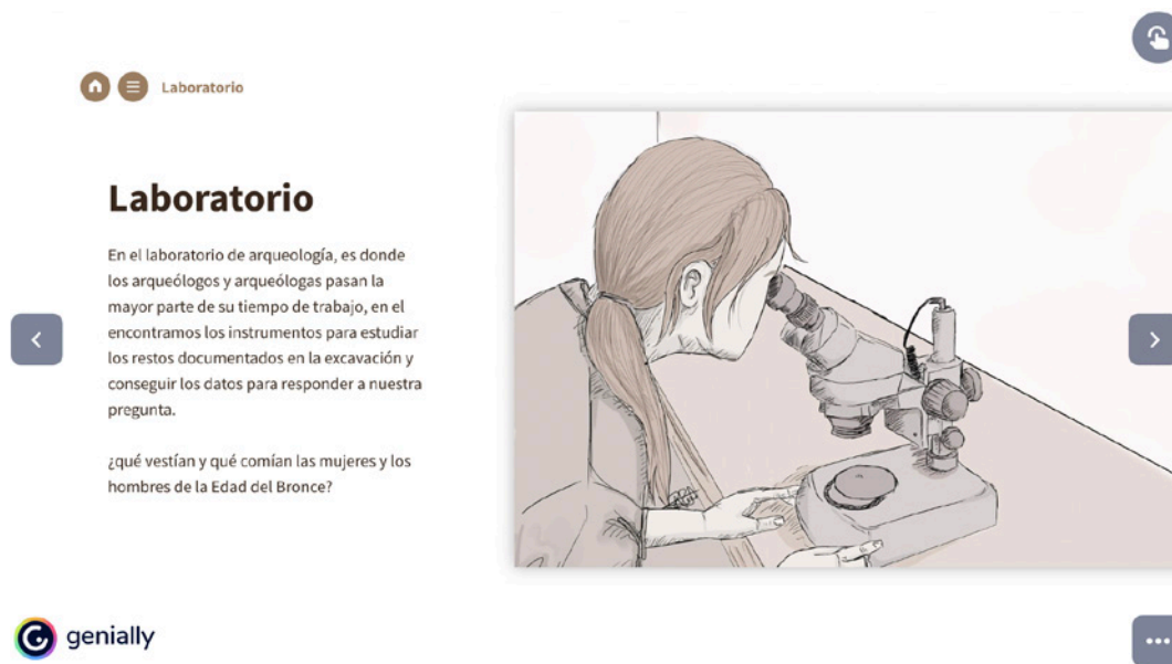
Figura 3. El trabajo de laboratorio.

Por último, el alumnado tiene que reconstruir cómo era la vida de las personas que vivían en el asentamiento gracias a los datos descubiertos durante su día como arqueólogo/a. En esta última fase se han incorporado ilustraciones que representan los objetos y restos arqueológicos en su momento de uso, lo que facilita al alumnado a desarrollar la capacidad de abstracción para poder llevar a cabo un acercamiento más humano y social a este pasado arqueológico a través de los objetos y las imágenes (fig.4).