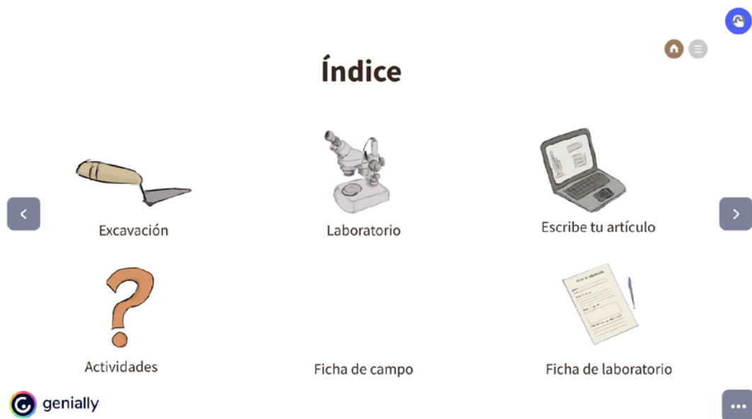
Figura 1. Estructura interna del recurso "Lo que la tierra esconde".

Así, en la primera parte se narra el proceso de excavación de campo a través de una serie de ilustraciones que muestran distintas actividades propias de las intervenciones arqueológicas, junto a un texto explicativo y participativo en el que los discentes van a trabajar durante un día con el arqueólogo/a. La trama del texto se desarrolla a partir de la explicación del arqueólogo/a al alumno/a de cómo realiza su trabajo.