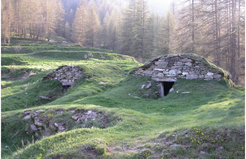
Figura 3: las triine (casa rudimental, en dialecto piamontés, para la producción y conservación de queso)

Partiendo de esta consideración, se podría iniciar un interesante campo de trabajo – de estudio y experimentación proyectual – ya que la montaña, por lo menos en Piamonte, en estos valles, es el paisaje por antonomasia, el telón de fondo de todos los territorios y, pues, de todos los proyectos.