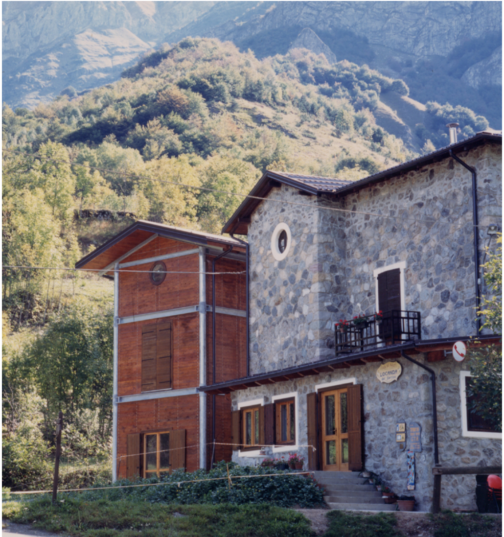
Figura 4: Bruna & Mellano arquitectos, Ampliación y renovación del albergue del Parque de los Alpes Marítimo, Entracque (Cuneo, Italia), 1998/2000

Así, la cuestión de una nueva estética de la arquitectura enfocada a la ecología termina por ser un falso problema, aunque pueda dar muchas respuestas. La que en este caso me interesa considerar es sobre todo una: hasta un cierto punto, la estética de la arquitectura ha sido por sí misma y de alguna manera, ecológica – a pesar de que para encontrar los materiales necesarios se llegara a erosionar las montañas excavando canteras y la construcción no despreciara el hecho de explotar grandes cantidades de mano de obra – porque la relación con el lugar y las técnicas que derivaban de tal relación conferían el