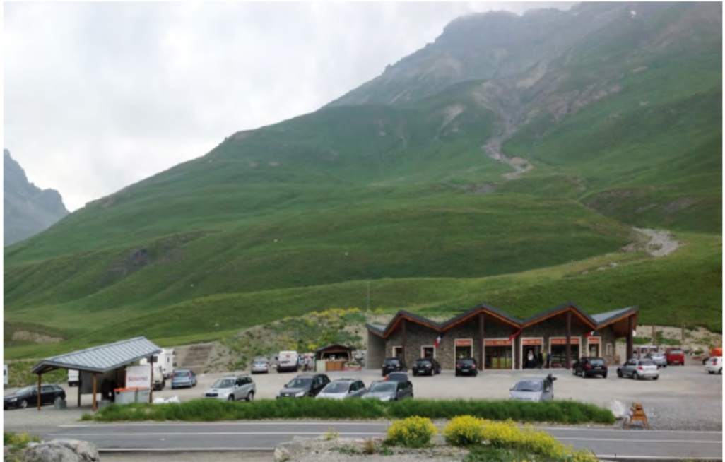
Figura 6: Bruna & Mellano arquitectos, Refugio de la Paz y servicios para los viajeros en el Colle della Maddalena , Argentera (Cuneo, Italia), 2010/13

Mejorar los lugares significa volverlos hospitalarios. Y una para que una arquitectura sea hospitalaria debe integrarse en el sitio con elegancia y sosiego; para dialogar con lo que constituye las pre-existencias no sirve gritar, sino mirar, observar, escuchar, conocer, entender e interpretar.