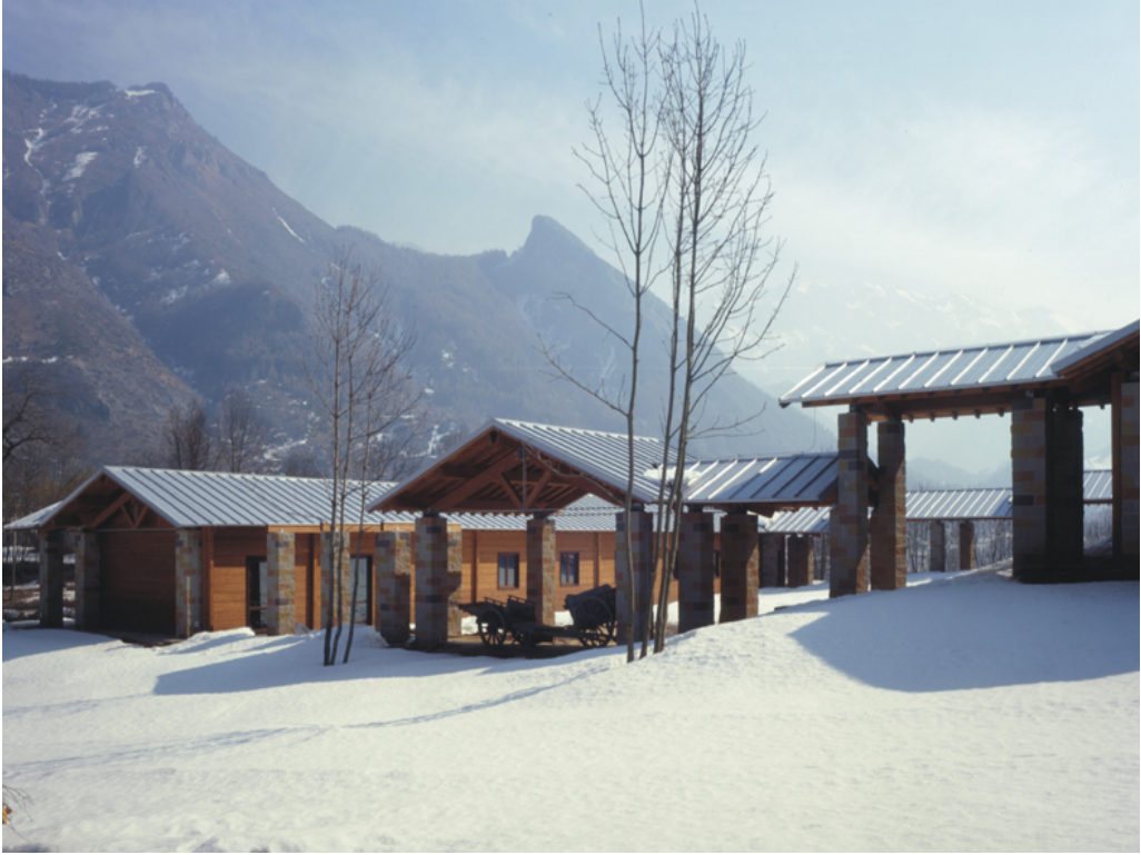
Figura 5: Bruna & Mellano arquitectos, Sede operativa del Parque de los Alpes Marítimos , Entracque (Cuneo, Italia), 1996/98

También está claro que podemos sustituir los troncos de castaño con madera laminar, los muros de piedra con hormigón, las tablas de alerce con chapa y crear nuevas formas con el ordenador (fig. 5): polilíneas, nurbs y volúmenes complejos no tienen secretos para los arquitectos actuales. Es necesario, sin embargo, que las nuevas tecnologías se confronten con el mundo que nos rodea y encuentren juntos una nueva armonía, una justa medida y que sepan adaptarse con garbo a los lugares, al igual que las construcciones de las “tierras altas”.