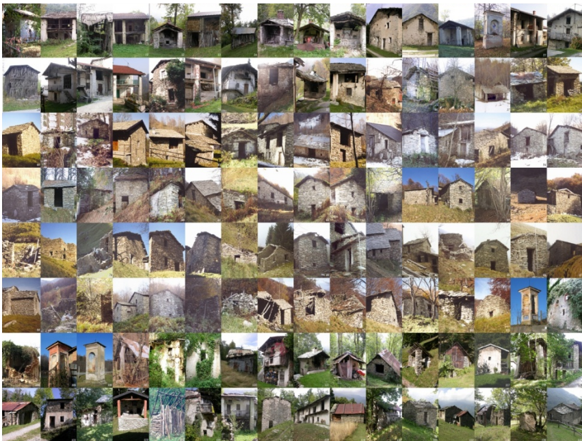
Figura 2: algunos de los edificios censados en los Atlas

El rico bagaje de fichas contenidas en los Atlas anteriormente citados, es significativo. Ya no por su originalidad y unicidad – hay muchísimos edificios parecidos en los Alpes piamonteses – sino porque estas construcciones, si bien testimonios de un modo de hacer y de vivir que no se da en la actualidad, expresan la cultura de un pueblo y la identidad de un paisaje. El hecho de que haya permanecido casi intacto con el pasar del tiempo, llama la atención, interesa y apasiona, ya que la capacidad de esos edificios es la de ser ellos mismos paisaje, la de haber dado vida a lugares, a ambientes en los que la construcción y el suelo que la acoge se han convertido en un unicum y, por ende, son representativos de un mundo en el que actualmente – y más aún a causa de la pandemia que ha cambiado nuestro modos de vivir – se están volviendo a descubrir valores que se habían perdido en el tiempo y de los cuales, por lo contrario, quisiéramos volver a disfrutar.