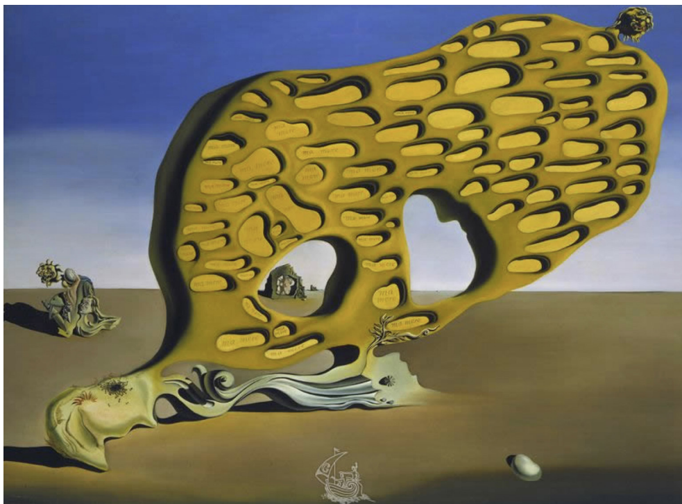
3. Enigma del deseo. Mi madre, mi madre, mi madre (1929).

edad los únicos momentos en los que él se siente plenamente él. Como en la obra de Rousseau, en la de Magritte el protagonista es un caminante solitario. La meditación del paseante solo es interrumpida por un elemento que, dispuesto en horizontal, contrasta con el resto de la obra. Se trata de un cadáver, que, por sus rasgos, se asocia con el de una mujer, su madre, que se había suicidado lanzándose al río Sambre cuando él era apenas un adolescente. La muerte de la madre, la separación radical que esta conlleva, implica necesariamente su constitución como sujeto autónomo. Podríamos decir, por tanto, que la representación de la madre no es la de una presencia como la propia palabra indica, sino la de una ausencia. Además, la disposición horizontal del cadáver se interpone entre el espectador y el protagonista de la obra negando la posibilidad de identificación entre uno y otro, impidiendo que el espectador pueda acceder a la subjetividad del representado [4]. Si bien es cierto que Magritte negó en varias ocasiones que fuese la muerte de su madre la que le influyese o llevase a crear esta serie de rostros velados, también es cierto que se negaba a cualquier tipo de interpretación teórica o literaria de su obra (Arenal, 2018).