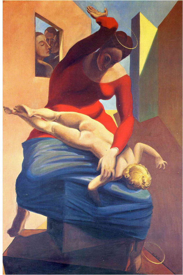
1. Max Ernst, Virgen castigando al niño delante de tres testigos (1926). Fuente: © VG Bild-Kunst, Bonn 2021

Cualquier atentado contra la familia era para los surrealistas un acto revolucionario. En el caso de las madres, guardianas de la moral, sus crímenes, para los surrealistas, muchas veces no eran de sangre, sino sexuales. Por ello, en un afán provocador, también Bataille ofrecerá una imagen de la maternidad que atenta contra los valores en los que