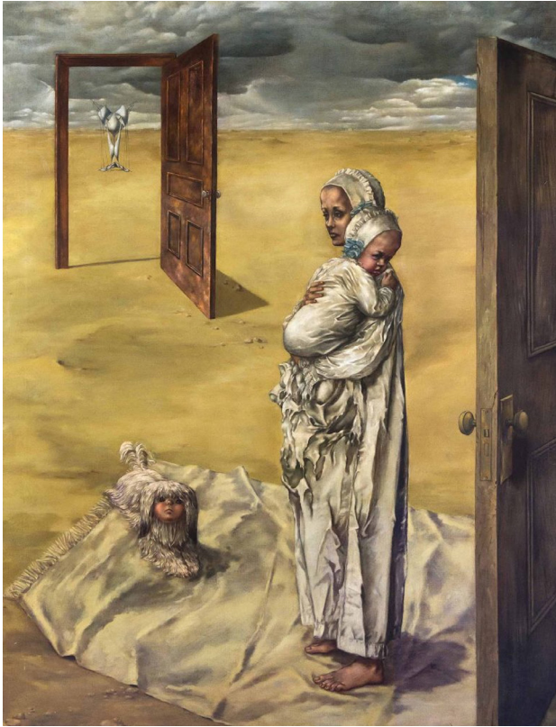
5. Dorothea Tanning, Maternidad (1946-7).

La artista como madre expresa un estado de tristeza y aislamiento reforzado por su inclusión en un paisaje desértico. Tampoco el niño parece haber sido representado como atributo para la madre. El niño en brazos de su madre mira en dirección opuesta a la misma, evitando cualquier conexión o contacto visual. No parece que la disposición de la madre respecto al niño sea como trono, ni como sostén, como lo haría habitualmente en las representaciones cristianas. De hecho, la atención se focaliza más en la figura de la madre –al aparecer dos veces– que en la del niño. La negación del amor, la ausencia afectiva de la que se carga la imagen, es la que permite en esta obra la representación de dos sujetos independientes sin supeditación del uno al otro [5].