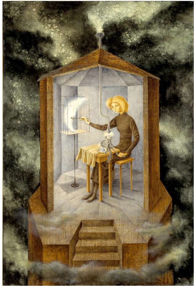
6. Remedios Varo, Papilla estelar (1958). Fuente: © Derechos Reservados 2015, Remedios Varo

A pesar de la multiplicidad de recursos e imágenes que como hemos visto utilizaron para denunciar la maternidad, si algo une a todas las representaciones que de esta hacen los surrealistas es la idea del desamor. Este desapego emocional puede ser producido bien por el empeño de deconstruir la imagen burguesa, bien por la necesidad de reivindicar la individualidad de un sujeto. La diferencia reside en que si bien para los surrealistas la presencia esencial sigue siendo la suya –la madre, como el resto de mujeres, aparece como una creación más del artista genio –, las surrealistas generan el espacio para reivindicar una presencia y existencia femenina más allá de la gestación y crianza de los hijos. El desamor es materializado en el Surrealismo mediante una ausencia de contacto o mediante acciones violentas. La falta de contacto físico o gestual aparece en toda una serie de imágenes frías como las generadas por Magritte o Tanning, en las que lo único que comparten madre e hijo es el espacio del lienzo. Acciones violentas como el escupir que veíamos en la obra de Dalí, el asesinato voluntario o involuntario