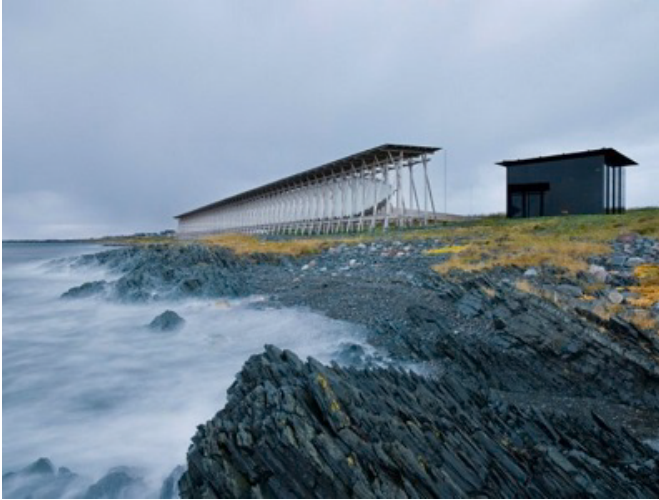
Figura 2: Peter Zumthor, Memorial Steilneset (Andrew Meredith).

De igual forma funciona la arquitectura de Alejandro de la Sota, construyendo también un entre el arkhéen su gimnasio Maravillas (fig. 3): Tierra excavada y mantenida donde corre el Aire irradiado por el Fuego que secará el Agua. Todo ello para acoger el futuro indeterminado de nuestra sociedad. Y también crea ese estar entre los dos algo inefable en la casa ‘La Caeyra’, en Pontevedra, para el Sr. Domínguez (fig. 4), esquematizado ese estar en el dibujo de interpretación de un texto de Saarinen que acompañaba las explicaciones de la casa por el autor, y que según Miguel Ángel Baldellou: “los conflictos latentes entre los conceptos dentro-fuera, arriba-abajo, abierto-cerrado, ligero-pesado, se concretan en uno más inmediato, que en esta casa en particular me parece fundamental: general-particular” 16 .