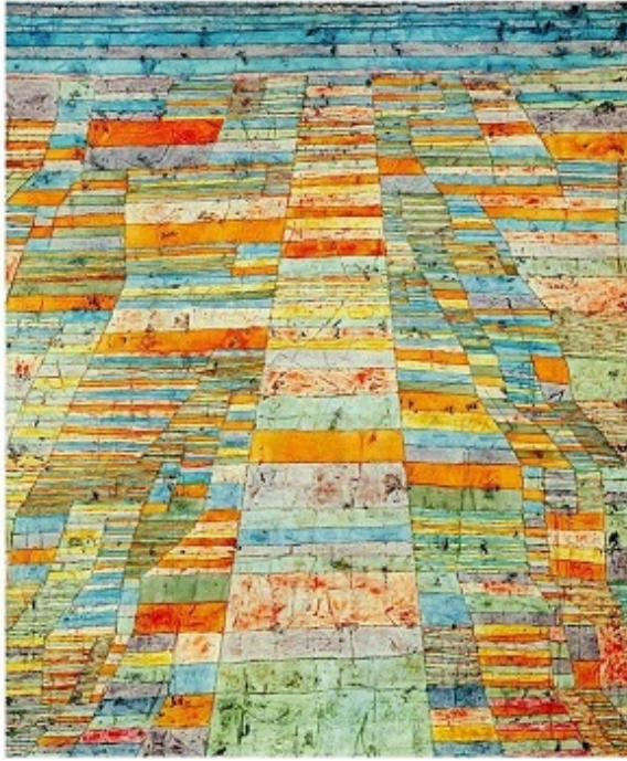
Figura 1: Paul Klee, Carretera y caminos laterales , 1929 (Will Grohmann).

Harpodonaptas –los primeros geómetras según Heródoto– armados de cuerdas de trece nudos dividían el espacio-tiempo en doce partes al igual que creaban formas proporcionadas. Mas su utilidad era establecer la variación de la propiedad de terreno tras las crecidas del Nilo para proporcionar el tributo correspondiente al faraón. O al menos eso creían. Los diseños eran del propio río, generador de vida, cuyas crecidas eran producto de una relación imposible fuego-agua: “Al girar el sol sobre Libia [...] atrae el agua para sí. [...] El sol, en una palabra, es en mi concepto el autor de tales fenómenos [las lluvias]” 1 . Buscaba hacer entender al hombre una relación, la que existe entre lo que es –el río– y lo que no es –los límites–, entre el brillante sol y el oscuro lodo. Relación entre contrarios. Heráclito el Oscuro sí supo entenderlo.