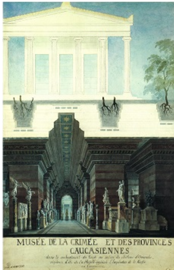
Figura 5: Karl Friedrich Schinkel, Proyecto para el Museo de Crimea (Staatliche Museen zu Berlin).

Y por lo tanto, también, entre aire y tierra (fig. 5):