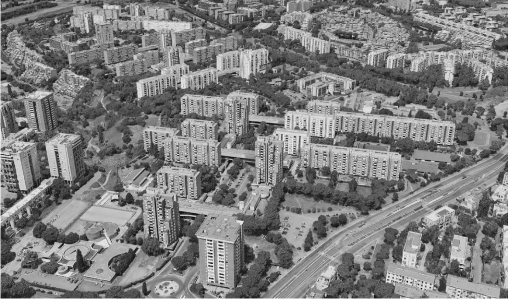
Figura 5: Veronica Strippoli, Vista aérea del barrio Laurentino 38 . (Google Earth).

La concepción de un diálogo flexible y actual sobre el rol del proyecto se convierte en una ocasión para revivir el paisaje urbano en forma unitaria; un paso necesario para anunciar una nueva sintaxis que restablece el carácter orgánico de lo construido, en sinergia con los elementos naturales y materiales presentes y con la voz de quien vive los espacios.