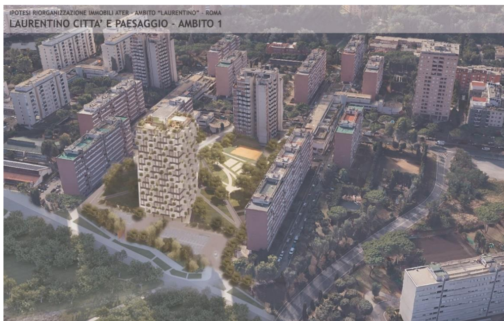
Figura 7: Raffaele Giannitelli, Laurentino Città e Paesaggio – ATER. (Surf Engineering S.r.l. Urban Design & Landscape).

Las experiencias recogidas evidencian una debilidad. La modalidad en forma de reunión con los ciudadanos, elegida por las administraciones públicas como forma de participación, representa unos límites en el programa de participación. En este caso el ciudadano cubre todavía el papel de informador marginal, un actor capaz solo de dar indicaciones en relación con el uso del espacio público y de transferir las necesidades y las solicitudes sobre su utilización. Por el contrario, un modo más inclusivo resulta ser el workshop , durante el cual se aumenta la colaboración entre las partes.