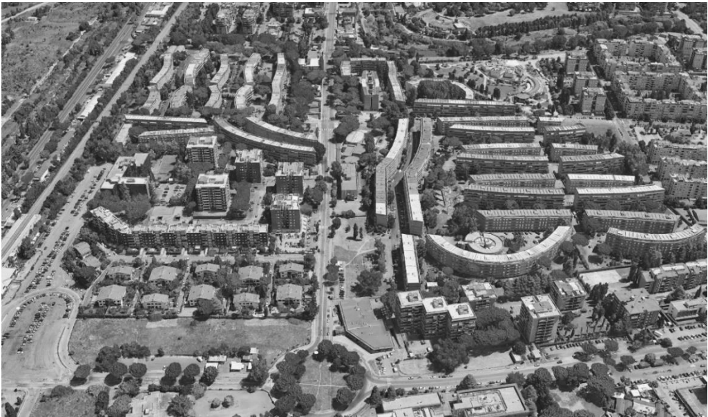
Figura 1: Veronica Strippoli, Vista aérea del barrio de Decima . (Google Earth).

Paseando entre los pilotis del barrio de Decima 3 , entre las secuencias espaciales abiertas deseadas por Luigi Moretti, entre la fluidez extensiva del verde, se aprecia el sentido de una heterogeneidad contemporánea: la compacidad y la austeridad de lo edificado, resuelto en la alternancia cóncavo convexo, ha interrumpido su diálogo con el territorio, con las escasas estructuras dotacionales del barrio, abandonadas o poco cuidadas, con el espacio de los pilotis , agredido y relegado a la función de aparcamiento. Esto nos induce a reconocer la necesidad de mejorar la cohesión social, como sentimiento profuso entre los habitantes, que se expresan a través de la mediocridad de la acción espontánea, imponiendo un principio de adaptación descuidado de los sofisticados conceptos arquitectónicos.