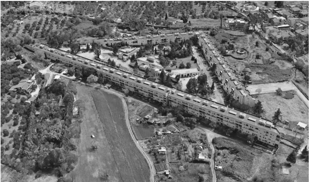
Figura 3: Veronica Strippoli, Vista aérea del sistema urbano del barrio “Adrianella” , (Google Earth).

Lo que hoy emerge es la presente necesidad de repristinar la centralidad del núcleo de los servicios evocando, sin reconstruirlos, el valor cumplido de un micro tejido urbano (fig. 3-4).