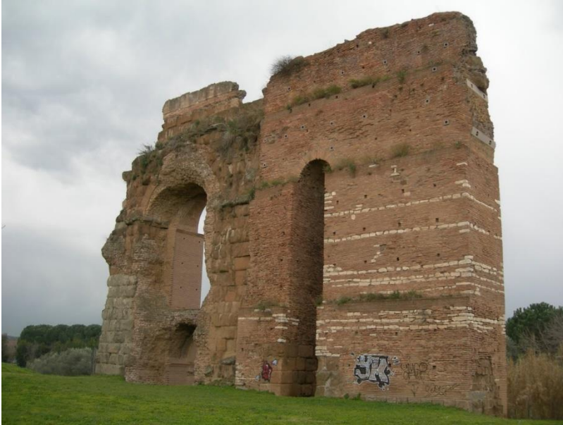
Figura 6: Roma, las ruinas de una sección del acueducto dentro del Parque Arqueológico de los Acueductos (Elaboración propia).