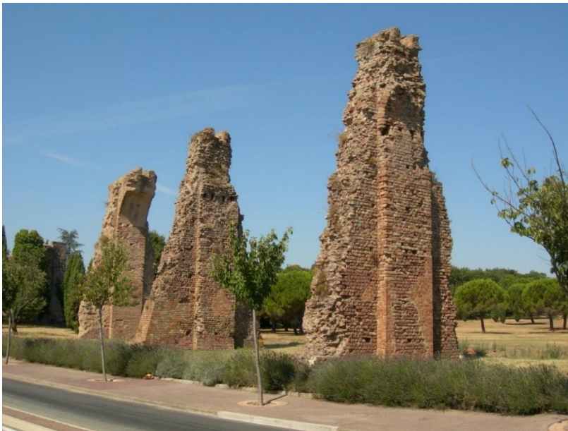
Figura 7: Fréjus (Francia), las ruinas de un tramo consistente del acueducto cerca de la ciudad.