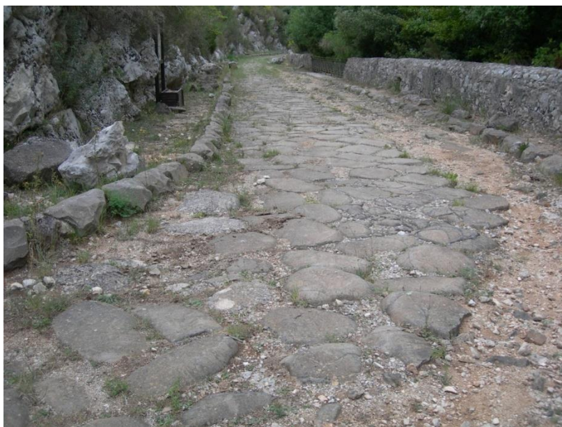
Figura 1: Itri (Latina), un tramo consistente de la Via Appia entre Fondi e Itri (E. Romeo 2018).

En tal enfoque a la cultura del paisaje resultan más vulnerables aquellas ruinas que, ya en su origen, adquirirían valor del contexto natural. Ejemplos de ello son las vías consulares romanas, arterias viales que comunicaban territorios colonizados y que se adaptaban a la morfología de los lugares, salvando valles con puentes, bordeando o perforando macizos rocosos, saneando y cultivando los terrenos por los que pasaban; también son ejemplo los acueductos que, cruzando territorios enteros, llevaban agua a los asentamientos urbanos con soluciones de ingeniería que, sin dejar de seguir la naturaleza orográfica de los lugares, proponían modificaciones interesantes desde el punto de vista hidráulico y estructural; o también los asentamientos fortificados que estructuraban el territorio para poderlo defender mediante una serie de emplazamientos estratégicos creando “lugares clave” de recogida y venta de productos agrícolas y artesanales.