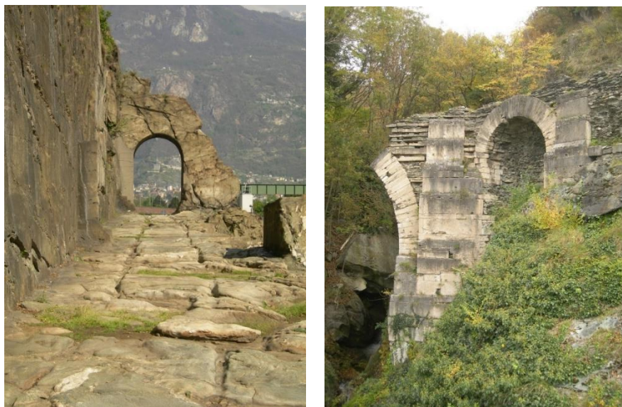
Fig. 3-4: Donnas (Aosta) el corte de la roca para facilitar el paso de la Via Gálica y el puente romano en Saint-Vincent (Aosta) siempre en la misma vía consular.

Lo mismo se hizo con los trechos aún conservados de la Vía Cassia y de la Vía Aurelia, frecuentemente inaccesibles y apenas visibles por los trazados paralelos de las autopistas, redes de ferrocarriles y línea del Tren de Alta Velocidad. Más en riesgo están los fragmentos de la Vía Emilia, identificables dentro de áreas de desarrollo industrial, o las trazas de otras arterias consulares existentes desde Friuli hasta Sicilia y que están incesantemente agredidas por urbanizaciones y grandes superficies. Una excepción es la reciente intervención de conservación y valorización de una porción de la Vía Emilia cerca de Módena, en la que se ha intentado resaltar un tramo conspicuo evocando, con instrumentos didácticos, la antigua vía consular 6 . Menos eficaces, pero útiles para conocer el sistema vial romano son los fragmentos de pavimentación conservados en las Arcas Escalígeras de Verona y en el casco antiguo de Rímimi.