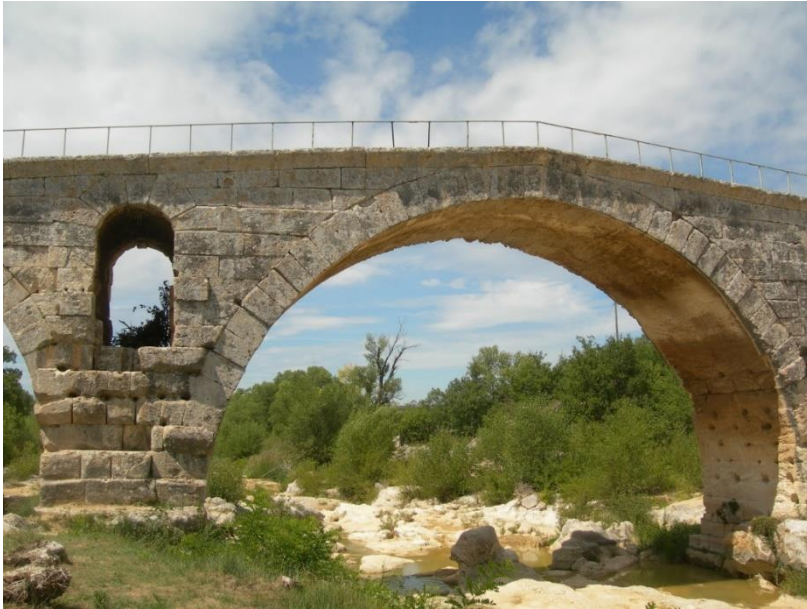
Figura 5: Apt (Francia), el puente romano a lo largo de la Vía Agrippa.