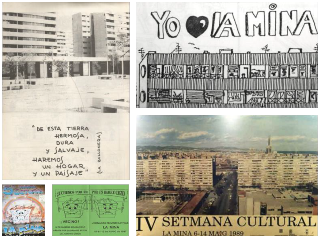
Figura 3: La representación del bloque en distintos documentos elaborados por el movimiento vecinal entre las décadas de 1970 y 1990 (elaboración propia a partir de los documentos conservados en el Arxiu Històric del Camp de La Bota i La Mina ).

comunicación y los propios vecinos, conviven en La Mina: la normalizada y la no-normalizada, la del civismo y la del incivismo 20 . Se descubre así cómo, incluso para sus habitantes, los bloques de La Mina son el territorio donde la pugna entre lo extraordinario y lo cotidiano se muestra de forma más visible.