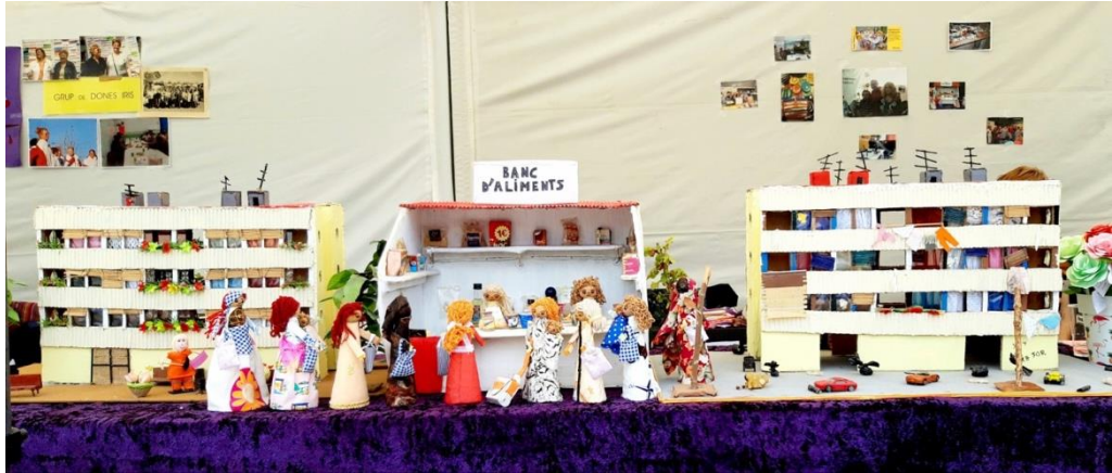
Figura 4: Maquetas de un “bloque bueno” y un “bloque malo” realizadas por el colectivo Adrianas de La Mina. Fotografía realizada por la autora durante el Encuentro de Entidades de la Semana Cultural de La Mina de 2019.

Quizá, la prueba más visible del enorme capital simbólico que los bloques de La Mina han llegado a concentrar se encuentre en la esperpéntica situación en la que el edificio Venus se halla inmerso desde hace casi dos décadas.