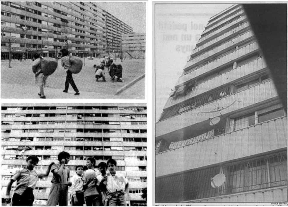
Figura 2: Los bloques de La Mina Nova en la prensa (elaboración propia a partir de las fotografías de Guillermo Puig en “La degradación de La Mina, combatida” en La Vanguardia , 16 de marzo de 1983; Pedro Madueño en “El ayuntamiento de Sant Adrià inicia la legalización de los pisos de La Mina”, La Vanguardia , 10 de marzo de 1991 y Xavier Bertral en “La Mina mira amb escepticisme l'enèsim pla de transformació”, Avui , 30 de abril del 2000 [vertical]).

La posibilidad de evocar, de forma simultánea, estos paisajes enfrentados se vio interrumpida muy pronto. Ya en 1974, la situación límite padecida por los habitantes de La Mina afloró en distintos medios de comunicación 12 . El abandono, la desatención y el desafecto 13 , se extendieron por el imaginario popular como las trazas más representativas del paisaje del polígono. Con el paso de los años, esta visión de La Mina fue recrudeciéndose y en la década de 1980, el barrio era un territorio de excepción para los vecinos de Barcelona y su área metropolitana.