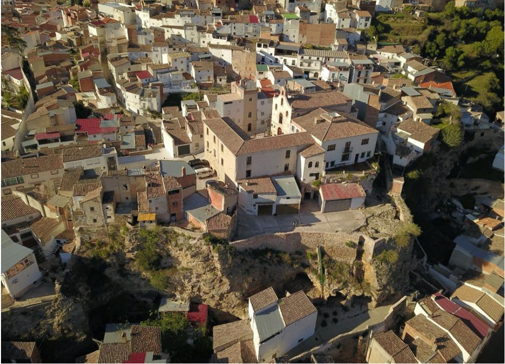
Figura 5: Lienzo sur del recinto amurallado de la Villavieja de Beas de Segura en el que se observa el fuerte impacto que tiene sobre el territorio natural circundante (elaboración de los autores).

patología, estudio de paisaje, análisis socioeconómico, estudio urbanístico, estudio jurídico, propuesta cultural y propuesta arquitectónica.