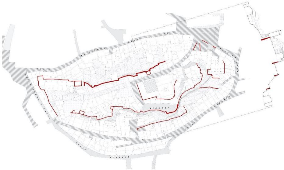
Figura 4: Plano de delimitación de los elementos murarios y fortificados del recinto recogidos en el Plan Director (elaboración de los autores para la redacción del Plan Director).

el espacio patrimonial se enfrenta a numerosos riesgos, entre ellos la ya mencionada pérdida de memoria colectiva, pero también la desaparición del comercio de proximidad, las dificultades de accesibilidad, la ausencia de equipamientos culturales y la sectorización demográfica. Muestra la necesidad de una visión multidisciplinar para empezar a redefinir el área (fig. 4).