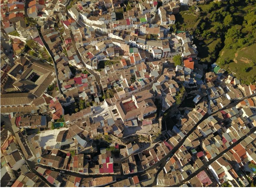
Figura 1: Vista aérea de la zona de Villavieja de Beas de Segura, en la que se aprecia el trazado del recinto amurallado y la incursión del tejido residencial (elaboración de los autores).