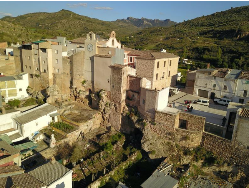
Figura 2: Lienzo norte del recinto amurallado de la Villavieja de Beas de Segura, en la que se observa la superposición de las viviendas sobre el recinto amurallado (elaboración de los autores).