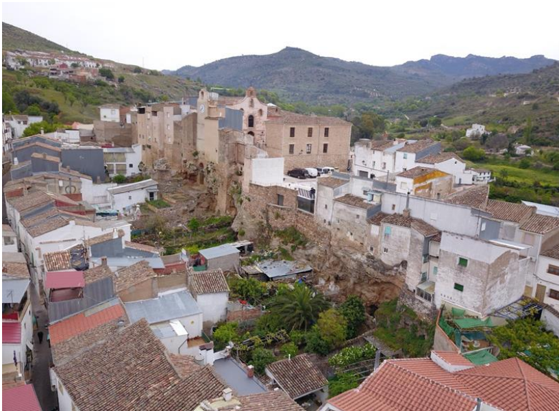
Figura 3: Lienzo norte del recinto amurallado de la Villavieja de Beas de Segura y el caserío que se ubica sobre el recinto y en torno a él como un elemento más de la propia historia de la evolución de esta área patrimonial (elaboración de los autores).

En la actualidad, el proceso de ocupación de la fortaleza con viviendas ha llegado a un momento límite, borrando muchas huellas y elementos patrimoniales del antiguo castillo y murallas. Estas coexistencias han generado un sistema complejo donde el patrimonio se fusiona con la arquitectura vernácula y, especialmente a partir de finales del siglo XX, donde nuevas construcciones sin ningún valor han transformado la propia naturaleza de la zona. Sin embargo, esta ocupación residencial pertenece ahora a la realidad patrimonial de la Villavieja, tras este largo proceso de fusión, lo que hace que no tenga sentido tener una imagen medieval idealizada de la fortaleza, sino asumir sus valores actuales. El patrimonio no es solo lo monumental: “el tejido urbano tiene dimensión histórica en toda su área, y el centro histórico es más que un simple agregado de partes” 3 (fig. 3).