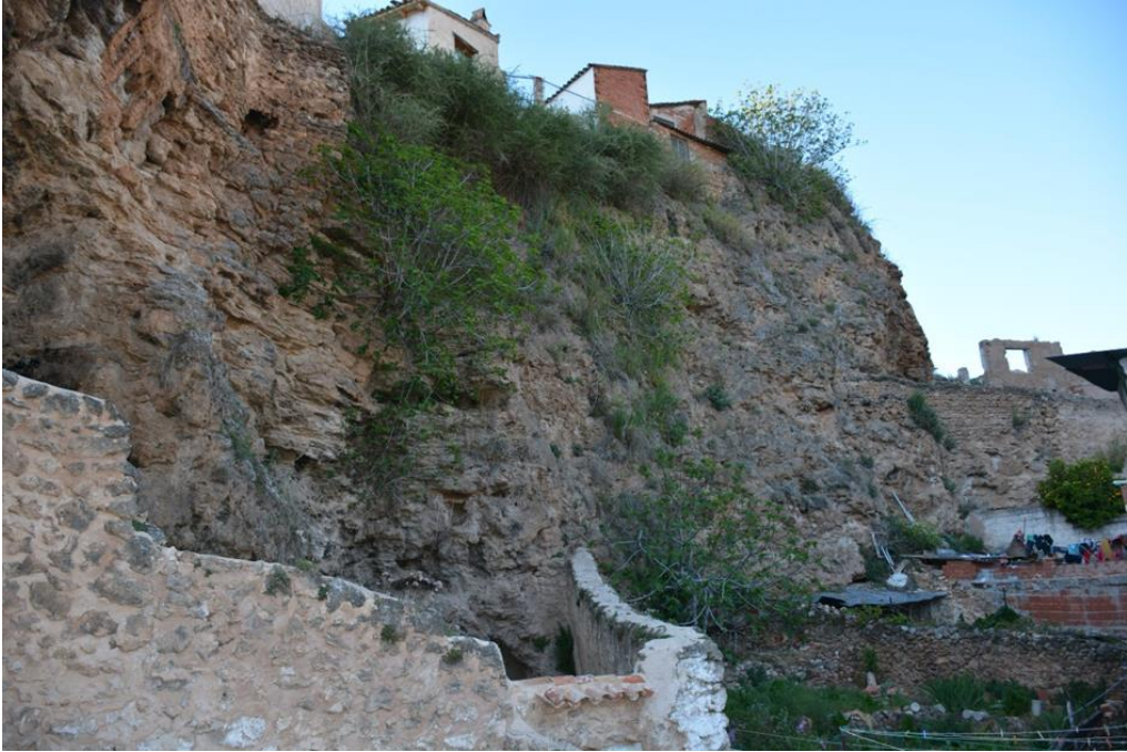
Figura 6: Detalle de la piedra natural (toba), junto con elementos construidos del recinto amurallado y elementos añadidos no controlados, por las viviendas que pueblan el ámbito patrimonial (elaboración de los autores).