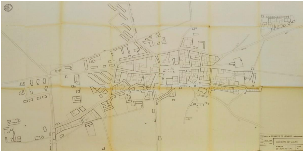
Figura 2: Jerónimo Onrubia, Proyecto de viales , 1964 (Oficina Municipal de Urbanismo de Azuqueca de Henares).

una zona de encuentro para los habitantes en la que se celebrasen acontecimientos de diversa índole. Actualmente, se trata de uno de los puntos negros, en lo que a tráfico se refiere, de la localidad. En ambos sectores los centros comerciales se proyectan linealmente y en zonas porticadas, sistema tradicional en la región y de gran adecuación con el clima.