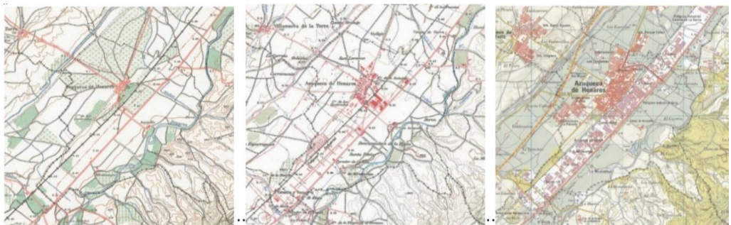
Figura 1: Secuencia de mapas de elementos cartográficos sobre mapa topográfico (1965 – 1985 – 2003) (Instituto Geográfico Nacional).

La ubicación estratégica de la localidad azudense y su conexión con las principales vías de comunicación (la autovía del Nordeste o A-2 y la línea de ferrocarril que comunica las ciudades de Madrid y Barcelona) han favorecido el crecimiento de la población y sobrepasado la previsión del proyecto inicial de la Mancomunidad de la superficie industrial a abastecer.