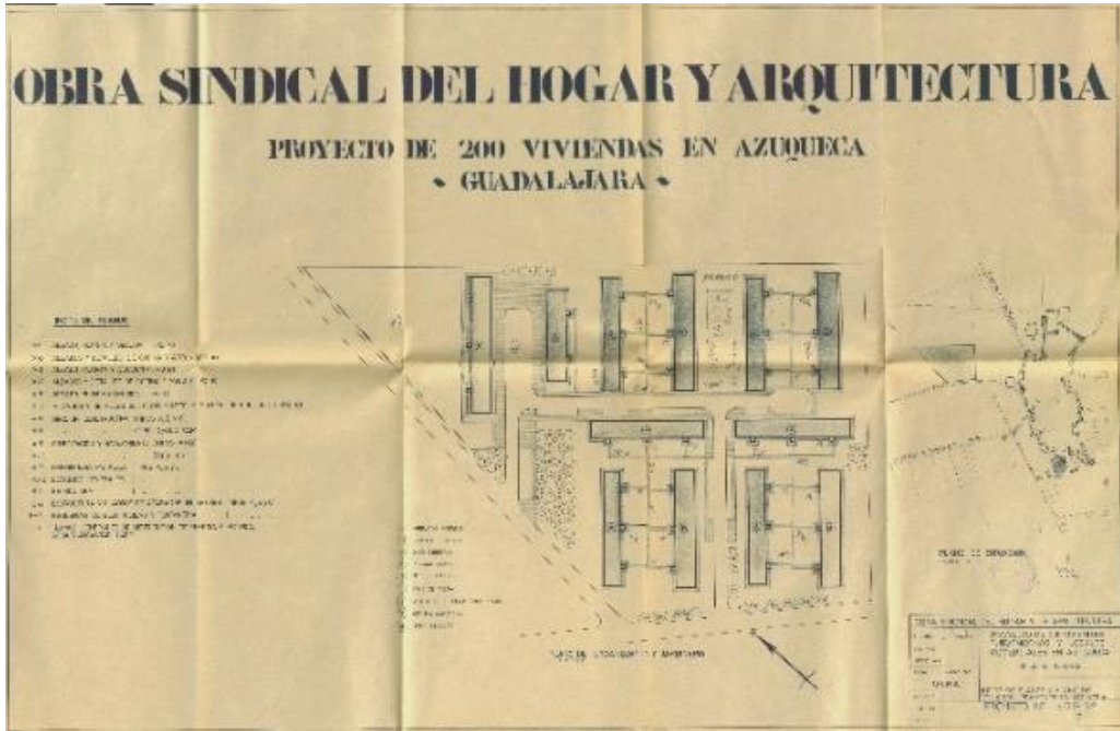
Figura 4: Jerónimo Onrubia, Proyecto de 200 viviendas en Azuqueca de Henares , 1963 (Archivo Histórico Provincial de Guadalajara).

El volumen de viviendas necesarias en los próximos años viene determinado por el crecimiento demográfico, la renovación de viviendas y el déficit actual de viviendas, siendo el crecimiento demográfico, por tratarse de una zona de fuerte dinamismo, el factor predominante. Según las estimaciones de las proyecciones de población, el número de viviendas que sería necesario construir entre 1975 y 1980 oscilaría entre 2.500 y 3.000, y en el periodo comprendido hasta el año 2000, la cantidad total ascendería a una cantidad entre 27.000 y 30.000 viviendas 4 . Dado el momento de su redacción, las expectativas demográficas y económicas desarrollistas llevaron a calificación de suelo y dotaciones que, con grandes desfases, no se han llegado a cumplir.