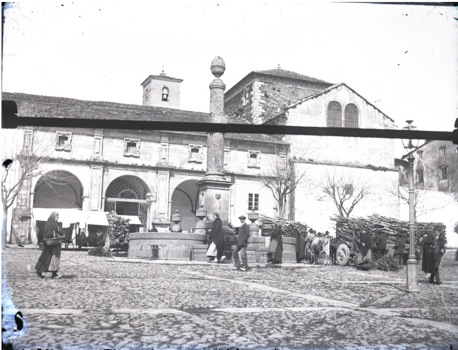
Figura 2: Maximino Reboredo, Lugo, plaza de Santo Domingo , década de 1890. (Colección de Julio Reboredo Pazos).

parte de su memoria fotográfica 7 , recogiendo con su cámara imágenes de Lugo en los años finales del XIX y principios del XX, inmortalizando los cambios operados en ella 8 . Además de detenerse en lugares y edificios emblemáticos, como la plaza mayor y el ayuntamiento –todavía coronada su torre con la estructura metálica de las campanas–, la fuente de los leones, el kiosco de la música, la plaza de Santo Domingo o la catedral, se interesa por la labor renovadora y los cambios que está sufriendo la urbe en sus aspectos urbanísticos y edilicios. Además de interesarse por las puertas de la muralla, deja constancia de la ampliación de la puerta de la Estación, abierta poco antes, o la apertura de la última que perforará este monumento, la del obispo Odoario, en 1921. Alguna imagen reproduce espacios de la urbe hoy inexistentes, como parte de los soportales de la plaza del Campo, derribados en los años treinta para ensanchar la calzada, en un afán de modernidad que hoy sería discutida.