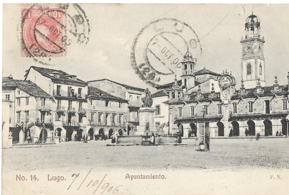
Figura 7: Francisco Nomdedeu, Lugo, Plaza mayor , anterior a 1905. (Colección Xabier Louzao).

alcance de todo el mundo 35 . La afición por las postales será tal que su producción se dispara, lo que se explica de varias maneras: en orígenes psicológicos, al afirmarse las posibilidades de poder viajar; se requiere mucho menos tiempo de escritura si lo comparamos con una carta y se desata la manía coleccionista. Como otros signos de la modernidad, su llegada a España es temprana, a partir de 1890, lo que acabará de popularizarla. Permitida su distribución en el país, su uso se extenderá rápidamente, popularizándose con la ilustración. El primer cuarto del siglo XX será su edad de oro, desarrollándose una industria de acuerdo con los progresos tecnológicos. Concentrada en sus inicios en Barcelona, pronto se diversificará su producción, que se caracterizará por su gran variedad temática. Serán sin duda las ciudades y sus monumentos uno de los temas protagonistas, en variados formatos, incluso desplegable e iluminadas 36 . Entre las casas más habituales trabajando para la ciudad pueden citarse las barcelonesas, Thomas, Alberto Martín, L. Roisin, Rogelio Nomdedeu y Francisco Nomdedeu (fig. 7), y las madrileñas Kallmeyer y Gautier, HM. Más recientes García Garrabella y Ediciones Arribas, de Zaragoza. Entre estas últimas se incluyen como novedad las vistas aéreas, puestas de moda a partir de la guerra franco-prusiana 37 , siendo precisamente Nadar quien en sus ascensiones en globo sacó las primeras, de París, en 1856.