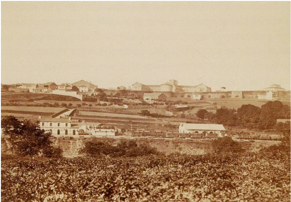
Figura 1: Jean Laurent, Lugo: Línea de Galicia. Vista de la estación y ciudad , posterior a 1874. (En Lenaghan y Seixas, Unha mirada... , 56).

La proliferación de estudios fotográficos en el último tercio del siglo XIX por toda España se da también en Galicia. A modo de ejemplo, si al concluir el siglo Barcelona contaba con 73 estudios y Madrid con 57, A Coruña se destacaba con 19, en un negocio que crecía a unas magnitudes desconocidas 5 . Pero además de los fotógrafos profesionales no podemos olvidar el importante papel de las fotografías de aficionados desde el mismo origen de la fotografía.