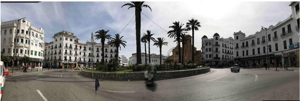
Figura 6: Plaza de Moulay el Mehdy.

Se pueden reconocer, así, las tres tendencias arquitectónicas fundamentales presentes en el Ensanche: eclecticismos en los que se suman y hacen visibles las distintas vanguardias de finales del XIX y una fuerte inspiración local; construcciones de base racionalista en las que la pureza lingüística es anulada por influencia de los regionalismos; y, finalmente, historicismos de corte escurialense y neobarrocos, sobre todo, que reflejan el debate arquitectónico que se desarrollaba en la España de aquella época.