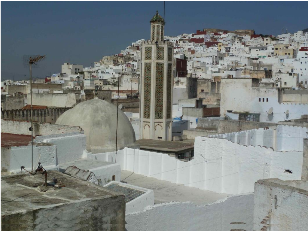
Figura 3: Medina de Tetuán.

El espacio urbano se especializa en la fabricación o venta de determinados productos, intensificando la actividad comercial en las principales arterias y diluyéndola en la metástasis silenciosa y vacía de sus adarves. La casa patio en sus distintas versiones materializa el espacio residencial. El patio es el núcleo central de la vivienda y articula el solar construido desde el vacío; el muro es solo piel y sustantiva la forma urbana. El sabat suelda y teje las distintas manzanas que, agrupadas por vínculos familiares, gremiales o profesionales y sin solución de continuidad, formalizan un organismo vivo en torno a las mezquitas y zagüías que refuerzan la conciencia ciudadana y la cercanía espiritual de un pasado común (fig. 3).