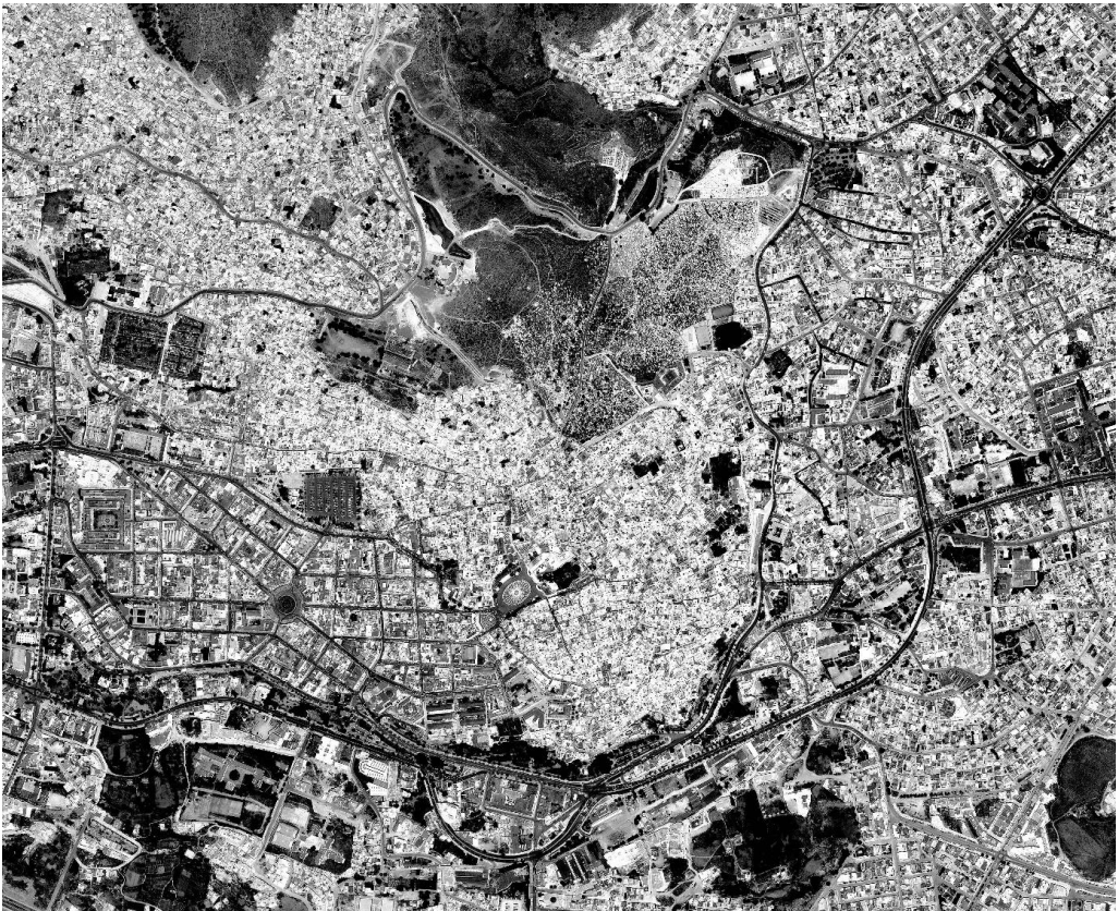
Figura 1: Cementerio, Medina y Ensanche de Tetuán. Vista Aérea (Google Maps).

La inminente caída del sultanato nazarí del Reino de Granada provoca en 1487 la emigración del caudillo de Piñar Sidi Ali Al-Mandari. Con un grupo reducido de vasallos cruza el estrecho y refunda Tetuán (fig. 1) en el valle del río Martil, entre las montañas del Gorges y el Dersa, donde antaño viera la luz la ciudad romana de Tamuda. Posteriormente, el decreto de expulsión de los Reyes Católicos de 31 de marzo de 1492 desencadena una importantísima migración tanto de musulmanes como de judíos al norte de Marruecos. Se consolida así una relación de vecindad entre ambas comunidades que en los cinco siglos siguientes convertirá la región en una de las más fértiles, pujantes y modernas del país.