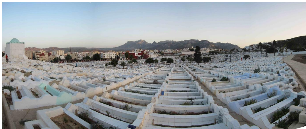
Figura 4: Cementerio de Tetuán, explanada de Lalla Rkya.