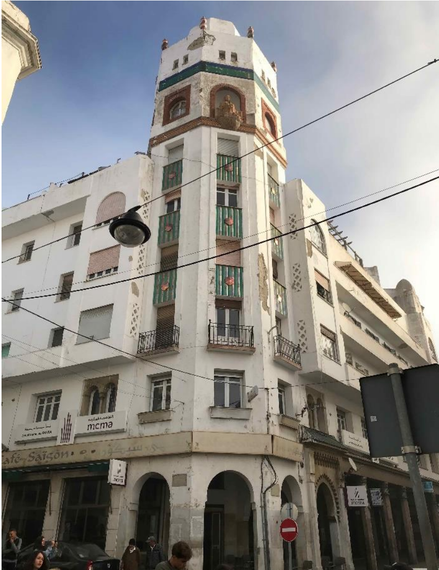
Figura 7: Edificio de La Equitativa.

Ambos edificios, coronados por los símbolos de sus respectivas corporaciones (el ave fénix y la equitas), sintetizan a la perfección las distintas tendencias arquitectónicas presentes en el Ensanche. En ellos, y asumiendo el nivel inferior de soportales impuesto por el plan de Muguruza (1943), el estilo internacional regula la composición de los alzados si bien, al mismo tiempo, se deja seducir por algunos de los gestos de carácter regionalista tantas veces ensayados en edificios precedentes: arcos de herradura doblados por otros polilobulados, tejarescos sobre ménsulas de mocárabes, bandas de azulejos,