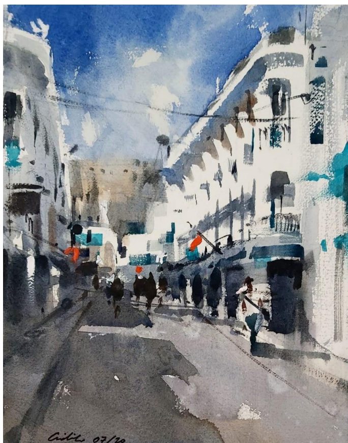
Figura 5: Ensanche de Tetuán (acuarela de Adrián Marmolejo).