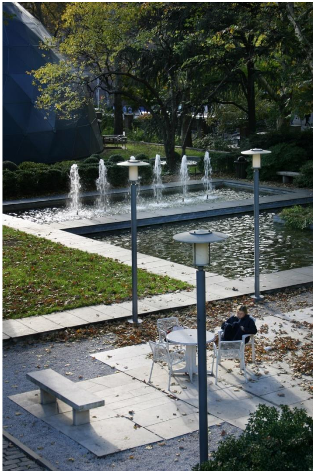
Figura 2: Dan Kiley, Jardín de los Filósofos , Rockefeller University, Nueva York.

prolongadas, para las que no había espacio 5 . Los cambios de nivel se enfatizaron mediante muretes de granito rematadas con bandas de masas arbustivas en su cota superior que subrayaban el ritmo visual sugerido por el terreno. En el extremo norte del campus, la terraza superior vuela sobre la plataforma inferior como un gran balcón que aparece perforado por una escalera de mármol suspendida de cables metálicos que conecta ambos niveles.