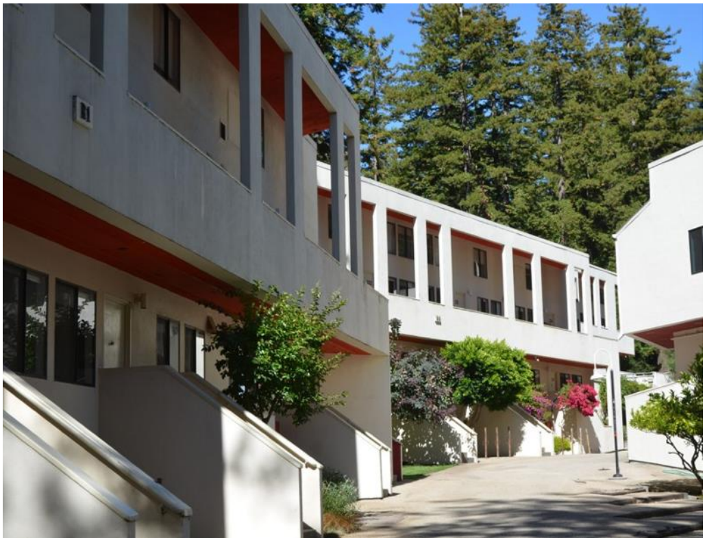
Figura 5: La calle principal del Kresge College.

A lo largo de todo el recorrido, el espacio no tiene una sección constante, sino que se estrecha y se ensancha en ciertos puntos para incluir plantaciones de naranjos y otras plantas mediterráneas. Las fachadas que configuran la calle, dispuestas intencionadamente de un modo no simétrico, sirven como soporte de parras, buganvillas, glicinias y otras trepadoras, en contraste con el verde omnipresente y perenne del bosque (fig. 5). Con sus senderos pavimentados, las fachadas perforadas con distintos tipos de huecos y la cadencia impuesta la secuencia espacial, el Kresge College configuró un ámbito de resonancias urbanas que introducía en el bosque la densidad social y la concentración de actividades de los que el campus carecía como conjunto y que resultaban necesarios para proporcionar al estudiante una experiencia universitaria completa.