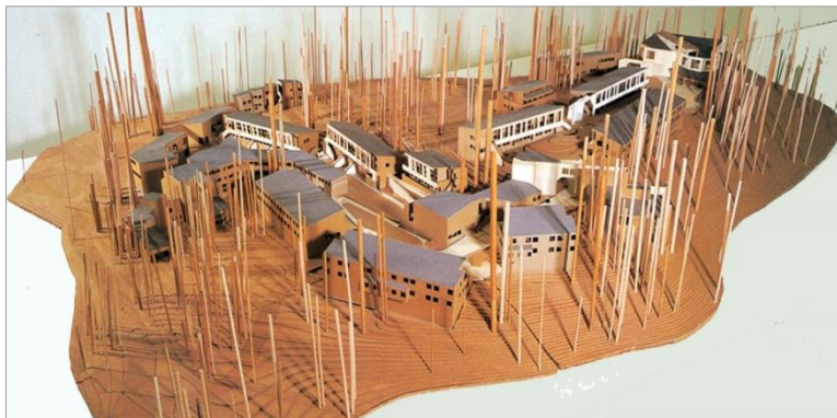
Figura 3: Maqueta del Kresge College (Fotografía de Roberto Osuna y María Teresa Valcarce).

En este contexto, los arquitectos Charles Moore, Donlyn Lyndon, William Turnbull Jr. y Richard Whitaker 9 , junto con el paisajista Dan Kiley, se propusieron con el proyecto del Kresge College crear ante todo un lugar que favoreciera el encuentro entre estudiantes y profesores y acogiera la vida en comunidad. El centro, construido entre 1971 y 1973, se planteó por oposición al entorno natural del bosque como un enclave urbano, como una ciudad mediterránea a lo largo de una calle a la que volcaban las distintas dependencias.