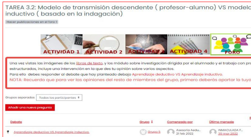
Figura 2. Foro de tipo pregunta-respuesta para recoger la opinión del profesorado.