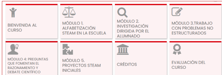
Figura 1. Aprendizaje por indagación como metodología para el desarrollo de proyectos STEM.

Promoting Inquiry in Mathematics and Science Education across Europe. Con estos materiales se creó una actividad formativa online en la plataforma Moodle, esta actividad se denominó “Aprendizaje por indagación como metodología para el desarrollo de proyectos STEM” cuyos módulos podemos ver en la Figura 1. En el curso 2021-2022 se ofertó la realización de este curso al profesorado de educación primaria y secundaria perteneciente a diversos centros educativos de Zaragoza.