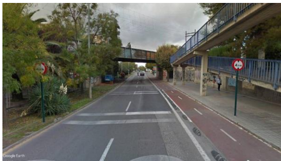
Imagen A: Avenida de Andalucía. (53)