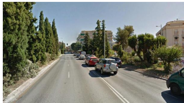
Imagen B: Avenida de Fuentesueva. (54)