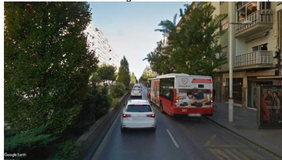
Imagen C: Camino de Ronda. (55)