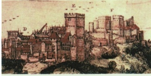
HUM-165: Patrimonio, Cultura y Ciencias Medievales