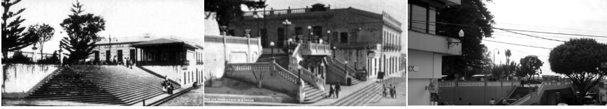
Figura 3 (izquierda), Figura 4 (centro) y Figura 5 (derecha) | Diferentes soluciones al acceso al parque Juárez desde el oeste