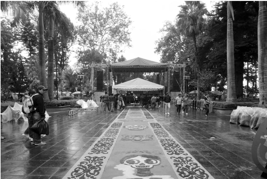
FIGURA 8 | Preparación del tapiz del Día de Muertos

El nivel 1 invita a pensar en una cruz latina, cuyo eje norte-sur parte de la entrada en la calle Juan de la Luz Enríquez hasta el Monumento al Benemérito. Es un pasillo amplio, con bancos a los lados, donde se celebran actividades cíclicas y/o cotidianas (Figura 8), incluida para ello la superficie cuadrangular del monumento. Este eje es cruzado por otro que discurre en sentido este-oeste. Su uso lo definen los puestos de botanas (venta de bebidas y alimentos) y boleros (limpiabotas). 1 Ambas actividades se desempeñan en pequeñas estructuras de fácil montaje, pero de ubicación permanente entre banco y banco.