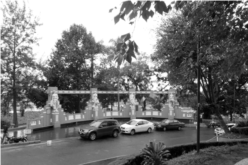
FIGURA 10 | Conjunto escultórico de las Virtudes

Finalmente está el nivel III, protagonizado por el conjunto escultórico de las Virtudes (Figura 10). En la parte posterior del conjunto, el diseño se resuelve con pasillos que discurren siguiendo la pendiente de la calle y facilitando la circulación peatonal. Espacialmente, y a pesar de quedar algo aislada por el paseo del Ayuntamiento, 2 el parque se consolida con esta “gran esquina” que le confiere una forma cuadrada al conjunto. Las esculturas de las Virtudes reinterpretan las de estilo clásico y adornan el paseo con los símbolos de los valores que promueven el entendimiento en una sociedad: Justicia, Fortaleza, Templanza y Prudencia.