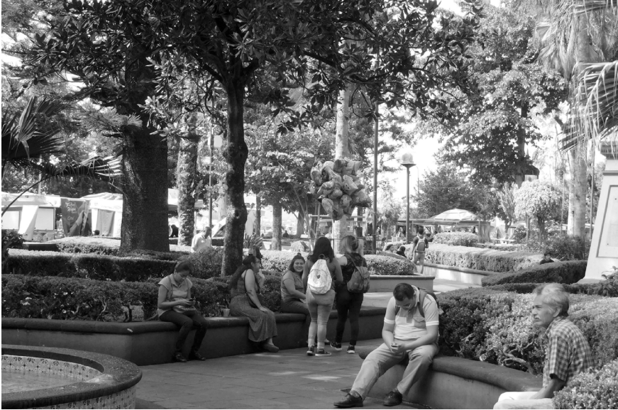
FIGURA 9 | Sector ajardinado y componentes de permanencia

localización del convento. Su escala las asegura como otra posibilidad de permanencia (Figura 9), al tiempo que embellecen y aportan frescor.