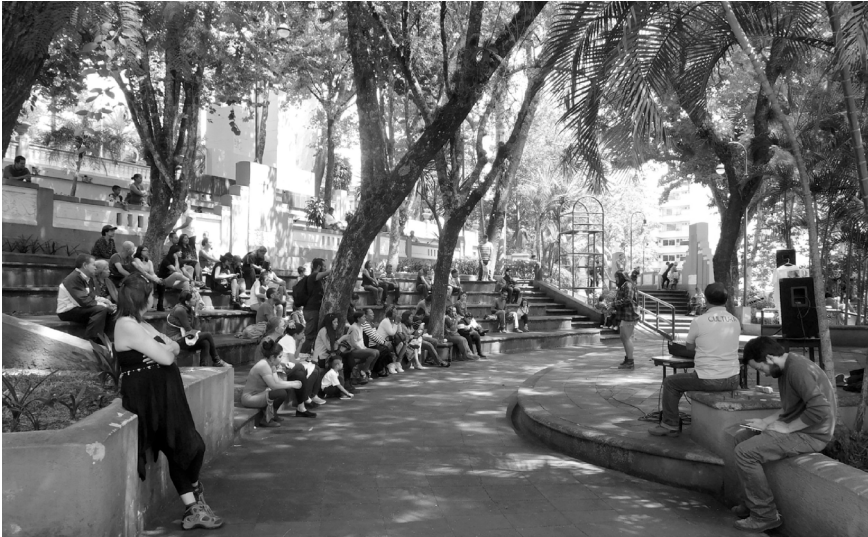
FIGURA 6 | El teatro que sustituye al Estanque de los Patos

Una tercera transformación fue la ampliación del equipamiento de permanencia, al sustituirse las rejas y/o bordes que delimitaban las zonas ajardinadas por borduras de obra, lo que supuso ampliar los asientos, actuando los parterres como espaldas (Figura 9). Pese a estos cambios, el parque ha mantenido en esencia el diseño original, algo importante en la construcción de la identidad del lugar y en la imagen de la ciudad como un legado heredado.