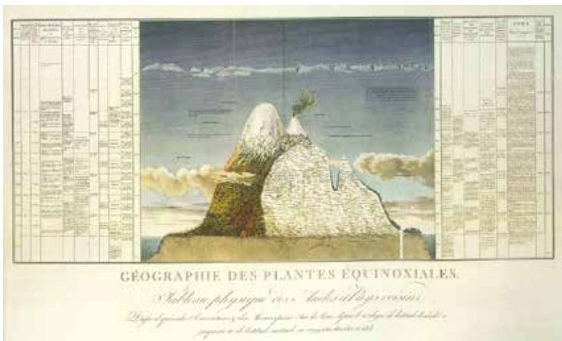
Figura 2. Alexander von Humboldt. Géographie des plantes équinoxiales. Essai sur la géographie des plantes, accompagné d'un tableau physique des régions équinoxiales. Paris: chez Fr. Schoell; Tübingen: chez J. G. Cotta 1805/7. La lámina está entre las páginas 22 y 23, sin numeración.