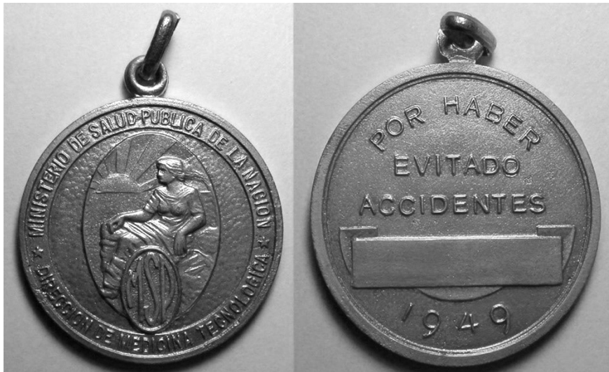
Fig. 2. Ministerio de Salud Pública de la Nación. Dirección de Medicina Tecnológica. Por haber Evitado Accidentes. Buenos Aires. 1949.

ciones de Profilaxis, Medicina Social y Medicina de Trabajo en la cual se promocionaban propagandas y acciones para prevenir lesiones y enfermedades entre los trabajadores, consejos de alimentación y un marcado sesgo moral en torno a las pautas recatadas sobre las conductas sexuales que tendrían que tener los trabajadores. Asimismo, la empresa estatal de Yacimientos Petrolíferos Fiscales comenzó a celebrar en 1941 el «Día de la Seguridad». En estas ceremonias se premiaba a aquellos empleados que habían salvado vidas o evitados desastres. Además, a través de afiches y publicaciones como el Boletín de Informaciones Petroleras se buscaba concientizar al personal.