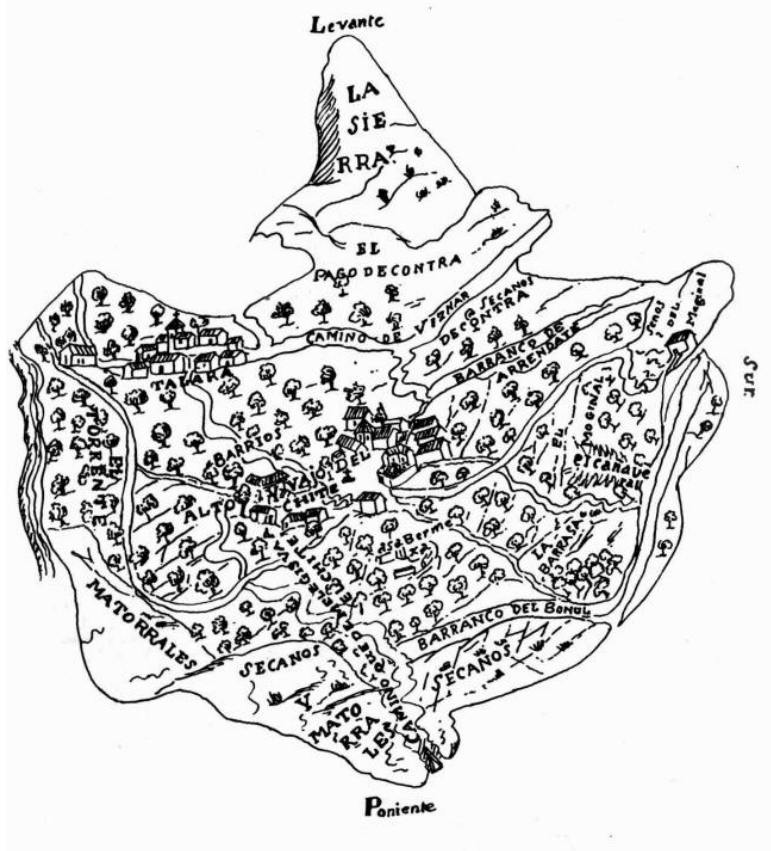
Mapa de Chite y Talará del Marqués de la Ensenada 1751.