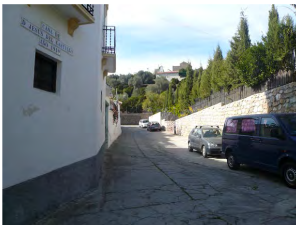
PUERTA DE CASA Y CALLE DE CHITE