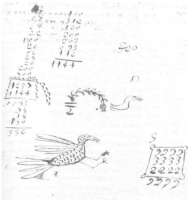
Página del Libro de Repartimiento de Chite y Talará