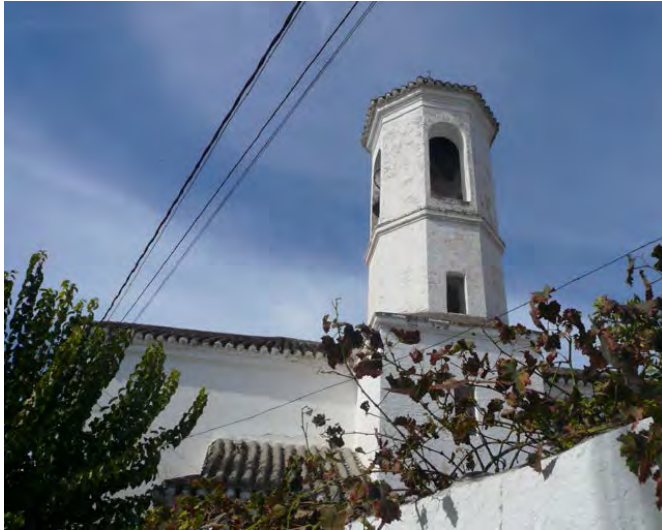
Iglesia de Chite