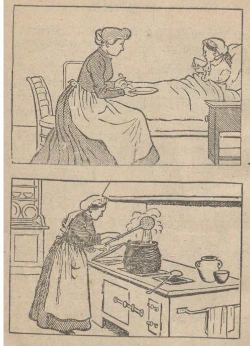
Ilustración 3. Grabados que ilustran la escena «Ande la mujer parida».