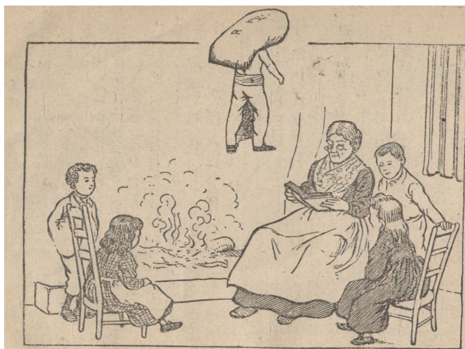
Ilustración 4. Grabado que ilustra la escena «Karvón».