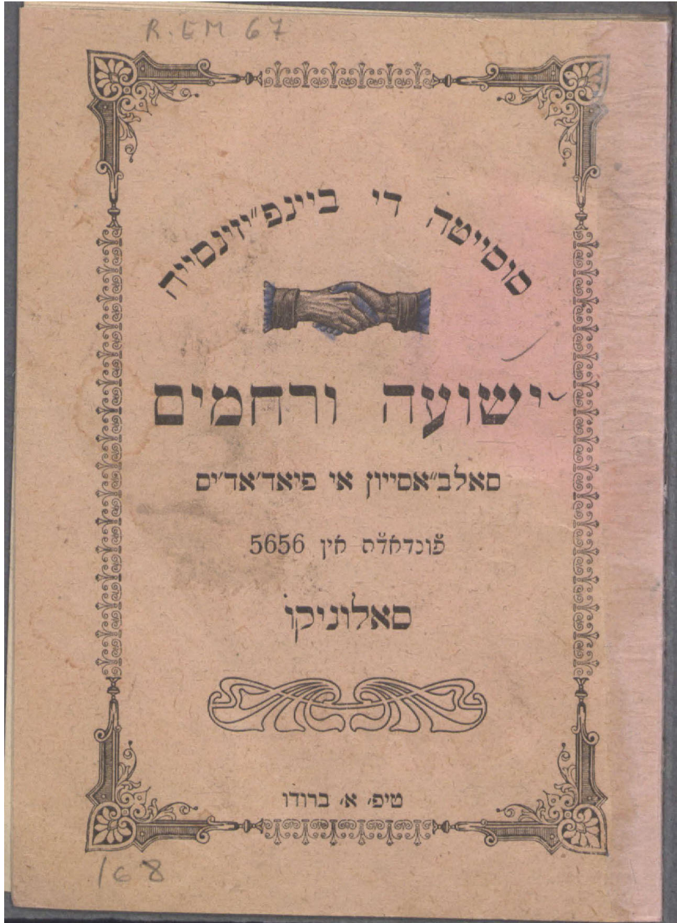
Ilustración 1. Portada del libro.