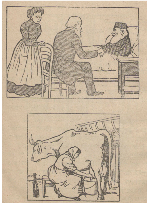
Ilustración 5. Grabados que ilustran la escena «Ande el hazino».