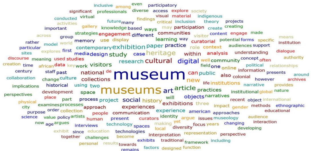
Figura 1. Resultados de la frecuencia de palabras en el conjunto de la muestra.

Para el análisis interpretativo, se utilizó un método cualitativo de análisis de contenido, basado en la técnica de reducción de datos por codificación (Miles, Huberman y Saldaña, 2019; Bazeley, 2013), que esencialmente consistió en clasificar los documentos de artículos recogidos por categorías temáticas y, a continuación, establecer contenidos principales respecto de cada una de ellas. Para ello, se utilizó la herramienta informática de Atlas.ti 8, que soporta información en formato de texto (documentos escritos) e integra herramientas específicas para el análisis cualitativo. El procedimiento de codificación se realizó en varias fases sucesivas. En primer lugar, se realizó una primera clasificación de los artículos en temáticas generales, basada los términos más frecuentes de la muestra. Para ello, se realizó la herramienta de cálculo de frecuencia de palabras de Atlas.ti 8, que se aplicó sobre las VI de título y resumen de los artículos. Estas fueron: “art”, “digital”, “exhibition”, “social”, “visitors”, “national”, “history”, “public”, design”, “experiences”, entre otras (ver Figura 1).