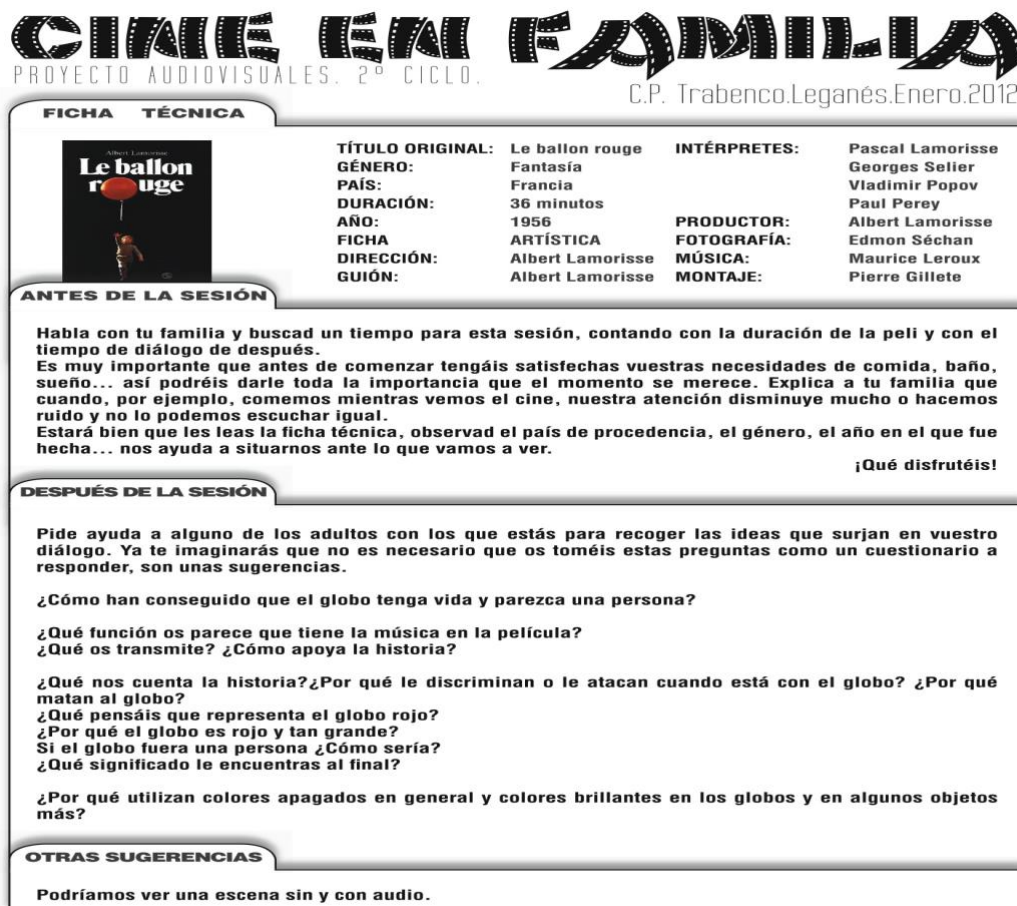
Figura 1. Cartel de Cine en familia, explicación de una sesión de Cine en Familia en el colegio Trabenco; fotografiado del archivo del AMPA del colegio Trabenco (2012).

“es una apuesta por buscar espacios en familia, preparados y cuidados, en los que pasar buenos ratos con esa magia que solo el cine consigue, estar juntos, conversar... Queda muy lejos ya de este uso habitual de la televisión como aparato permanentemente encendido que nos va sirviendo en bandeja y sin esfuerzo lo que ella decide y nosotros tragamos sin apenas digestiones” (Trabenco, 2018).