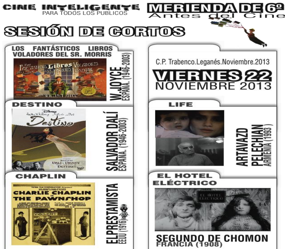
Figura 2. Cartel de Cine Inteligente, Programación de una sesión de Cine Inteligente en el colegio Trabenco; fotografiado del archivo del AMPA del colegio Trabenco (2013).

“Pretende ofrecer cada cierto tiempo en el colegio, la posibilidad de compartir una o varias piezas audiovisuales, disfrutando de un posterior diálogo entre personas de edades muy diferentes pues este es un reto importante como comunidad educativa, necesitamos espacios comunes que nos encuentren, que nos enseñen a escucharnos, en los que divertirnos juntas, más allá de planteamientos de actividades en las que las personas adultas vamos como acompañantes de la infancia, o actividades en las que el público infantil parece que no tuviera cabida” (Trabenco, 2018).