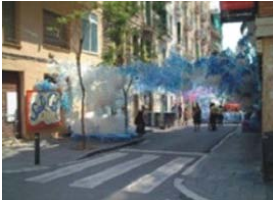
Figura 3. Adorno de c/ Joan Blanques (2002).