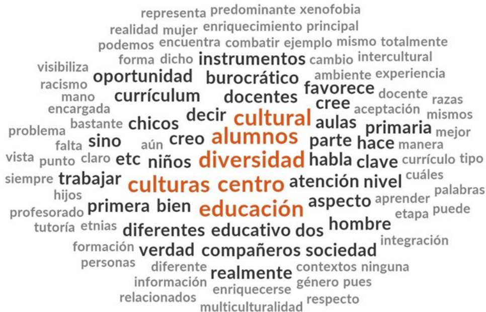
Figura 1. Categorías que más se repiten desde el centro hacia afuera.

En primer lugar se realizó una nube de palabras con las categorías que más se repetían.