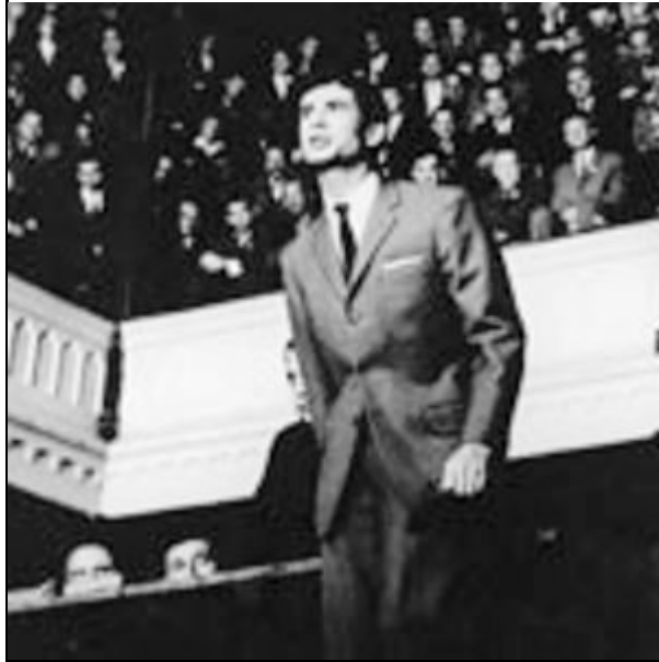
Foto 11. K. ante el tribunal.