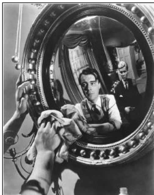
Foto 5. Las relaciones de poder son asimétricas, como en El sirviente de Losey.