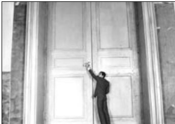
Foto 1. La insignificancia del individuo ante el Estado ( El proceso de O. Welles).

Parece cierto que uno de los problemas-clave en nuestra cibersociedad del cambio climático del III Milenio, sea la paulatina e inconsciente pérdida de capacidad de decisión individual, al ser arrastrados en la vida cotidiana por las exigencias laborales y las ilusiones sociales, consumiendo consumo. La satisfacción de las necesidades biológicas en el orbe industrial e hipercomunicado, se lastra por el estrés ocasionado por el desigual reparto de bienes a cargo de fuerzas fragmentadas y globalizadas al mismo tiempo, que participan de una estructura de poder ubicua, camuflada, anónima, supuestamente democrática y virtualmente inamovible. Y quizás lo peor, interiorizada por los súbditos. Todo ello en una jerárquica, autoritaria y pasiva sociedad del espectáculo y el despilfarro , donde aparentemente triunfa la tecnofelicidad, cobijadas las instituciones estatales y financieras bajo la densa sombra del hipnótico poder mediático.