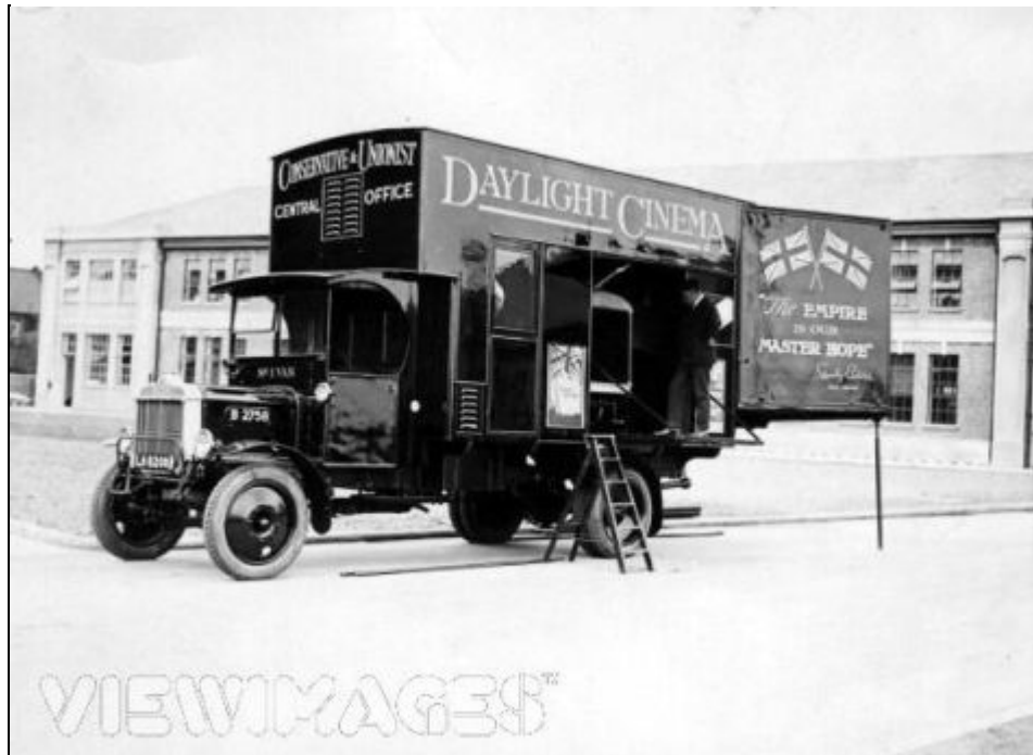
Foto 2. Uso político del cine.

De hecho, son escasas las películas que no reflejen alguna forma de poder, bien como espejo de la realidad o para presentar modelos. En gran número, las consideradas como cine político , se puede decir que es su tema central: cómo se alcanza; las prebendas y corrupción de quienes lo ejercen; su dominio sobre las vidas; la lucha de clases a través de las huelgas; la victoria de un bando sobre otro; la biografía (real o ficticia) de personajes poderosos, tanto ejemplares como odiosos. Si nos atenemos a uno de los géneros más filmicos, el western , se muestra una gran variedad de manifestaciones del poder: guerras contra los indios, disputas territoriales entre colonos y ganaderos, banqueros-bandidos, vaqueros héroes y villanos, solitarios y marginadas. Tanto los míticos uniformes del 7º de Caballería como las placas de los sheriffs son signos del orden legal, aplicado por los inmigrantes europeos.