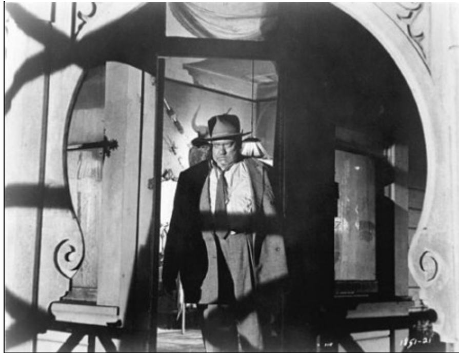
Foto 8. El malévolo cap. Quinlan en Sed de mal .

Pero su filme donde quizás el poder adquiere la consistencia más simbólica, y el propio espectador se siente encarnado en el angustiado señor K. , en su lucha contra el corrupto sistema judicial que le procesa sin motivo, es El proceso (1962), uno de los pocos que pudo realizar y montar a su gusto. Antes de entrar en su análisis, bueno será una introducción metodológica (2) .