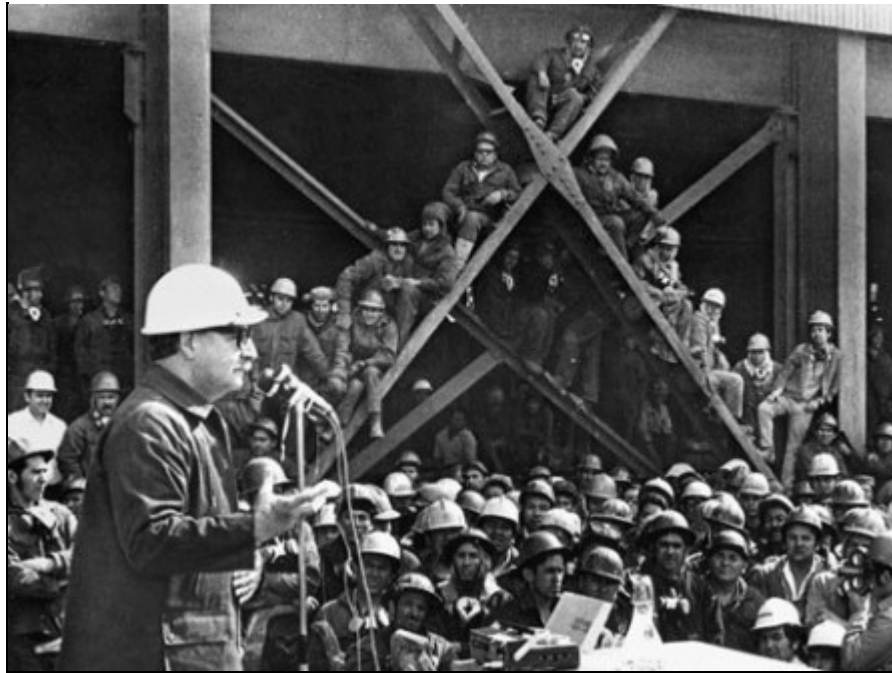
Foto 3. La lucha obrera fue contestada con el golpe de Estado.

Volviendo a las recreaciones semidocumentales, éstas pueden ser rigurosas, como en tantos filmes etnográficos (desde los clásicos Nanook de Flaherty -1922- y Las Hurdes de Buñuel). En el cine narrativo, abunda la reconstrucción de enfrentamientos entre clases sociales enemigas, con la huelga como conflicto básico en luchas sociales por el poder. Entre las escenificaciones más rigurosas se cuentan las de Eisenstein, respecto a las revoluciones soviética ( El acorazado Potemkine , Octubre ) y mexicana ( ¡Que viva México! ) (1925, 1927 y 1932).