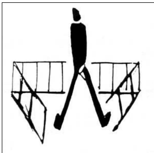
Foto 9. Dibujo introspectivo hecho por Kafka.