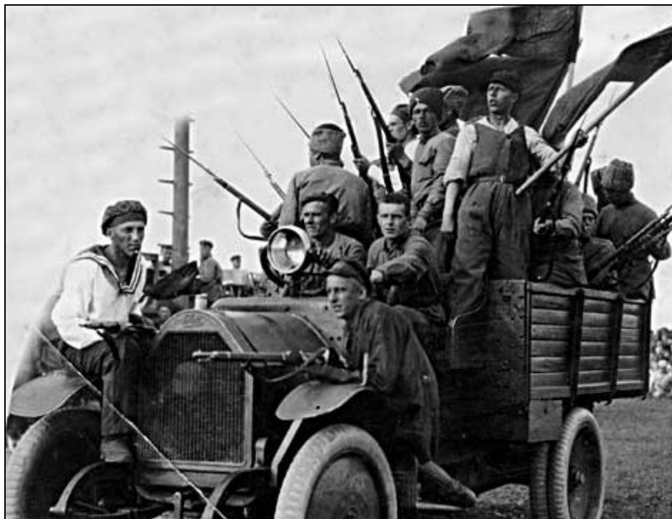
Foto 4. Recreación del pueblo tomando el Palacio de Invierno.

Volviendo a las recreaciones semidocumentales, éstas pueden ser rigurosas, como en tantos filmes etnográficos (desde los clásicos Nanook de Flaherty -1922- y Las Hurdes de Buñuel). En el cine narrativo, abunda la reconstrucción de enfrentamientos entre clases sociales enemigas, con la huelga como conflicto básico en luchas sociales por el poder. Entre las escenificaciones más rigurosas se cuentan las de Eisenstein, respecto a las revoluciones soviética ( El acorazado Potemkine , Octubre ) y mexicana ( ¡Que viva México! ) (1925, 1927 y 1932).