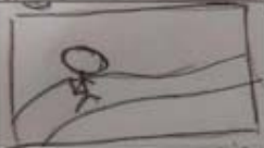
Imagen 3. Storyboard para un spot de 20" sobre la crianza vulnerable.