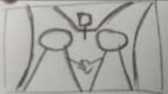
Imagen 3. Storyboard para un spot de 20" sobre la crianza vulnerable.