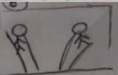
Imagen 3. Storyboard para un spot de 20" sobre la crianza vulnerable.