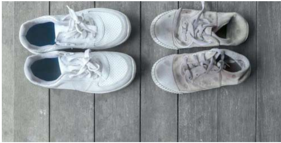
Imagen 2. Imagen con que se asocia la infancia vulnerable.