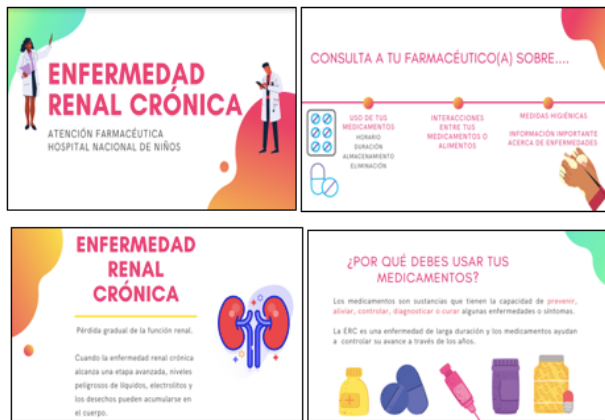
Figura 1. Imágenes del rotafolio elaborado.

Se elaboró un rotafolio informativo para ser usado por los farmacéuticos durante la consulta (Figura 1). Cuenta con una sección introductoria, en la cual se explica el concepto de atención farmacéutica y las funciones de los farmacéuticos para el mejoramiento de la salud. En la segunda sección se tienen en cuenta las definiciones y características de la enfermedad renal crónica, signos y síntomas y la importancia de cumplir correctamente el régimen farmacoterapéutico. La última sección incorpora consejos para mejorar la salud del paciente, tomando en cuenta aspectos como: práctica de actividad física, buenos hábitos alimenticios y correcta hidratación, control comorbilidades, importancia de evitar la automedicación; y control y reporte de efectos adversos de sus medicamentos.