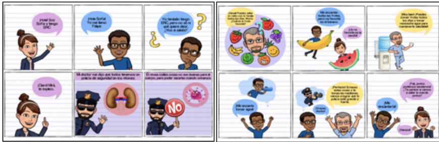
Figura 2. Imágenes de la historieta elaborada.

Las fichas de farmacoterapia contienen información importante de los medicamentos que estos pacientes toman regularmente. Estos medicamentos se encuentran en la Lista Oficial de Medicamentos (LOM) de la Caja Costarricense de Seguro Social, aprobados para ERC en población pediátrica. Entre la información descrita en estos materiales, se encuentran: vía de administración, presentación disponible en el hospital, uso del medicamento, indicaciones para su preparación en casa para suplementos electrolíticos, recomendaciones para una administración correcta, almacenamiento adecuado, posibles efectos adversos (Figura 3).