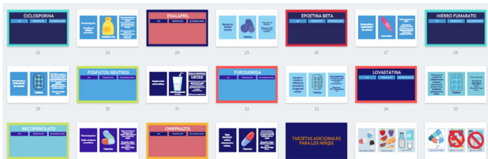
Figura 4. Tarjetas para evaluar la comprensión de la farmacoterapia.

Se diseñaron tarjetas para evaluar comprensión de los temas por parte de los pacientes pediátricos y sus cuidadores acerca del uso adecuado de los medicamentos (Figura 4).