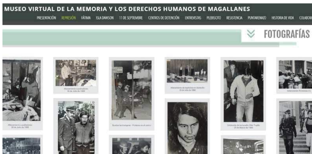
Figura 2. Imagen de la sección "Represión" de la página web del Museo Virtual de la Memoria y los Derechos Humanos de Magallanes.

En la actualidad participan y colaboran distintas entidades públicas chilenas como: la Secretaría Regional Ministerial de Justicia y Derechos Humanos Región de Magallanes y Antártica Chilena; y la Dirección Regional del Consejo de la Cultura y las Artes.