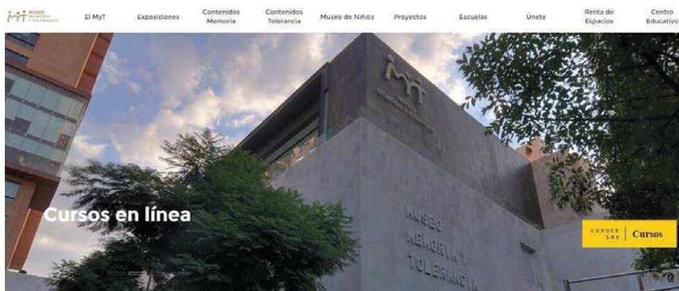
Figura 1. Imagen de la sección "Cursos en línea" de la página web del Museo Memoria y Tolerancia.

Una de las partes más interesante en la página web tiene que ver con los cursos en línea que el museo ofrece a través de la plataforma Centro Educativo Truper. La plataforma del Centro Educativo Truper se concibe como un espacio digital que ofrece cursos gratuitos en línea a todas las personas interesadas que, por motivos geográficos, no pueden asistir a las instalaciones del Museo Memoria y Tolerancia. Como indica en su web, todos los cursos están abiertos al público en general y versan sobre diversos temas en materia de derechos humanos, género, no violencia, actualidad nacional e internacional, arte y actualización docente. Algunos ejemplos de cursos ofertados son los siguientes: