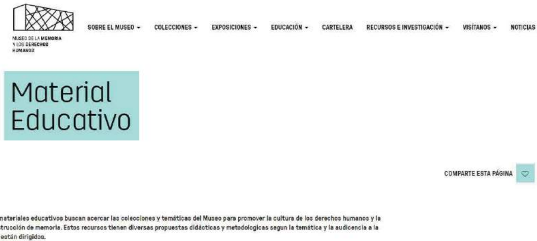
Figura 4. Imagen de la sección "Material educativo" de la página web del Museo de la Memoria y de Derechos Humanos.

En la página web del museo, en la sección de educación, podemos encontrar un apartado destinado a materiales educativos. Estos recursos ofrecen distintas propuestas didácticas y metodológicas dependiendo de la temática y la audiencia a la cual están dirigidos: materiales especialmente dirigidos a docentes y materiales didácticos elaborados para el público infantil.