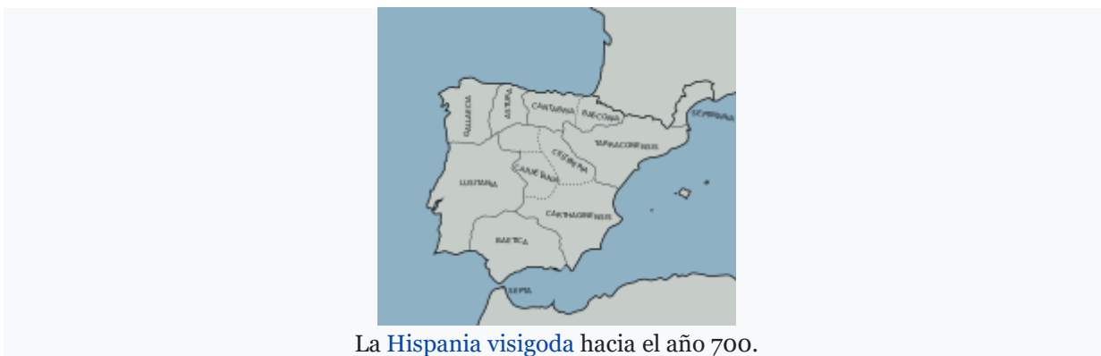
La Hispania visigoda hacia el año 700.

La Bética fue romana hasta que en el 411 d. C., cuando los suevos, vándalos y alanos tras la invadir el Imperio occidental, se establecieron en la península ibérica 66 . El imperio romano pidió a los visigodos ayuda contra los suevos (Requiario). Con Teodocio II las tropas visigodas cruzan a la península ibérica, quedando la mayoría de ésta en manos visigodas y dependiendo del reino visigodo de Tolosa. En el 476 los visigodos se asientan definitivamente en la Hispania cortado las invasiones de otros pueblos en el 490 y permaneciendo hasta el 710.