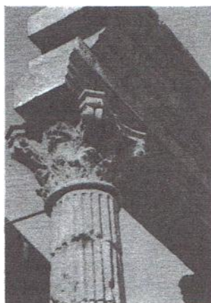
Capitel corintio encontrado en las ruinas romanas de Tarragona. El capitel corintio surge como una variante del jónico, diferenciándose de éste por una mayor riqueza en la ornamentación.

En Hispania romana había dos tipos de ciudades, las indígenas y las de nueva fundación. Entre las primeras hemos de diferenciar las estipendarias de las libres. “Ciudades estipendarias” son, las que conservando su propio derecho, han de pagar un tributo, mientras las “libres” serán de dos tipos, las “libres toleradas” que poseen gran autonomía y mantienen su organización administrativa y las “libres inmunes”, exentas de toda carga