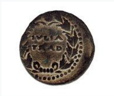
Reverso de as de bronce emitido bajo Augusto por la Colonia Iulia Traducta , ya que numerosas comunidades de la Bética gozaron del privilegio de emisión de moneda fiduciaria desde finales de la república hasta Calígula.