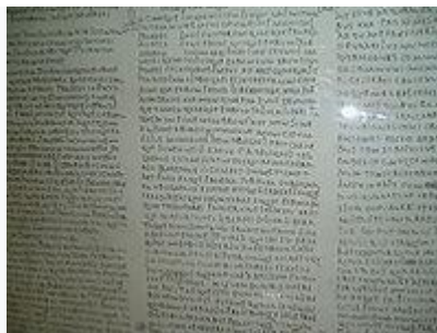
Lex Malaca . Reproducción de la Lex Flavia Malacitana en el Museo Loringiano de Málaga.

La Lex Flavia Malacitana , también conocida como Lex Malacae , es un compendio de cinco tablas 63 compuestas por estatutos jurídicos que establecen el paso de la ciudad de Malaca (Málaga) de ciudad federada a municipio de derecho Latino menor dentro del Imperio romano.