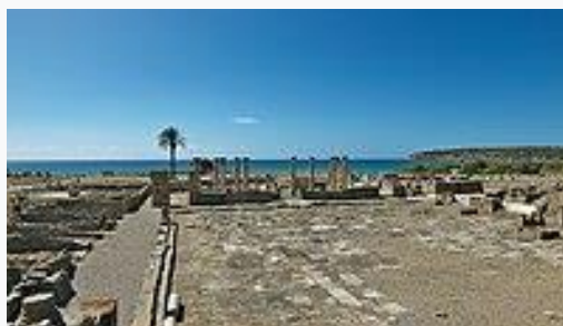
Plaza del Foro de Baelo Claudia . Baelo Claudia fue una ciudad romana situada en la ensenada de Bolonia , en la actual población de Bolonia , a unos 22 km al noroeste de la ciudad de Tarifa , en la provincia de Cádiz (España).

La Bética tuvo una importante aportación al conjunto del Imperio Romano, tanto desde el punto de vista económico como cultural y político.