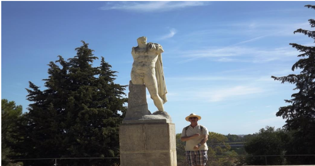
Entrada al yacimiento de Italica , cerca de la localidad de Santiponce (Sevilla).

I in primo luogo di tutto, desidera mettere l'annotazione della mia gratitudine al professore Andrea Trisciuglio dall'occasione andare alla incurta Dipartimento di studi storici e agli insigne romanici spagnoli che in questi giorni avremo l'opportunità di condividere questo corso di Storia e Diritto nella Spagna Romana