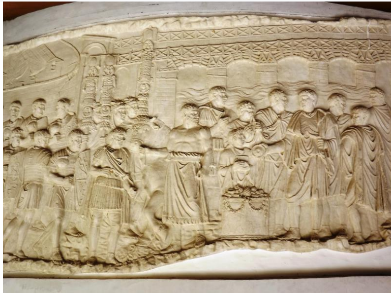
Bajo relieve de entrada al yacimiento de Italica , actual Santi Ponce (Sevilla).