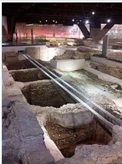
Factoría de salazones. Museo Anticuarium Sevilla.