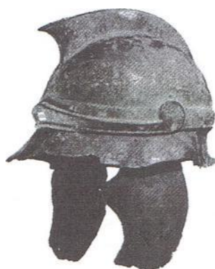
Gálea del soldado romano. La necesidad de mantener continuamente un ejército bien equipado, en territorio hispano, hizo que se resintiesen las finanzas de Roma.

Un estudio de J. M. ROLDÁN analiza perfectamente estos aspectos.